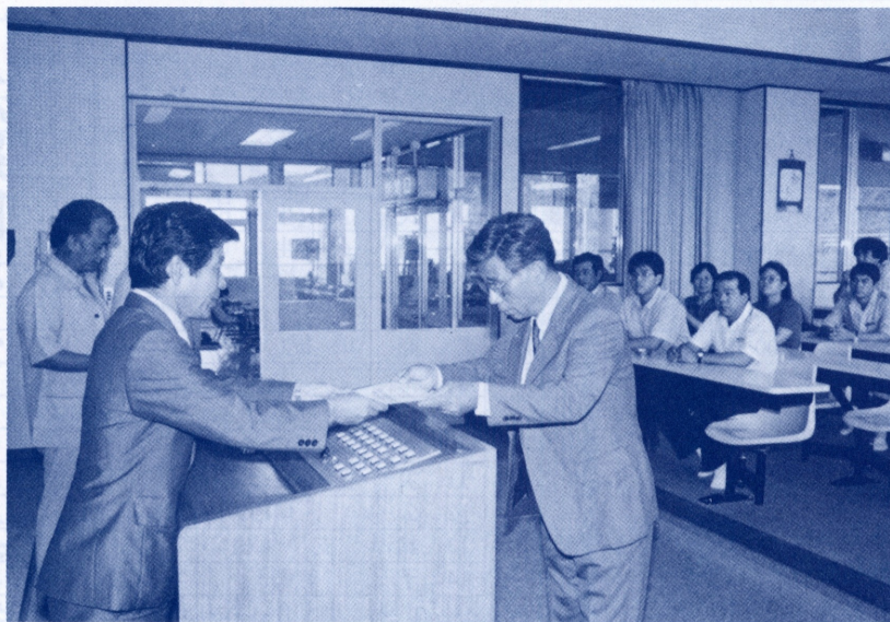
「文教のまちづくり」をめざし、社会教育関係委員へ委嘱状を交付＝5月11日、町中央公民館にて

日 時：昭和63年6月14日・17日・21日 24日・30日 午後2時～4時 場 所：西原町社会福祉センター 定 員：25名(定員になりしだい切り) 申し込み先：町役場保健衛生課 ☎5-5013(内62)