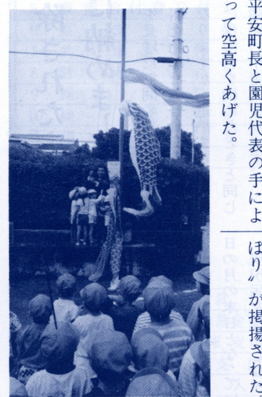
「こいのぼりの歌」に合せこいのぼりを掲揚 : 5月2日、町役場にて

「元気な良い子に育て」と町(平安恒政町長)では、五月二日午前、町役場庁舎構内において、こいのぼりの掲揚式を行った。掲揚式には、町内の小川保育園、坂田保育所の園児八十名余が参加、「こいのぼりの歌」を全員で元気よく歌う中、平安町長と園児代表の手によって空高くあげた。