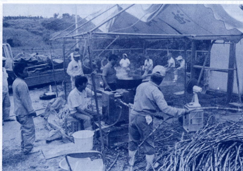
昔ながらの手法で「黒糖づくり」を行い自治会交流を図る＝5月8日 14区、池田公民館前広場(昔サターヤー跡)