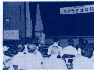
町学推協総会のもよう : 5月17日、町中央公民館