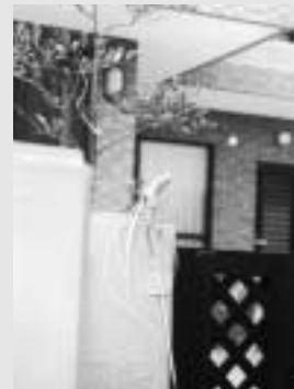
シバサシ・翁長の民家にて

九月のはじめごろ、お話をうかがうため、あるおばあさんへ電話をする。「私は（旧暦）八月は忙しいよ」との返事。「あ、ゲートボールですか？」とたずねると、「違うよ、日曜日はヤシヌウガン（屋敷の拝み）でしょ、また（旧暦八月）十日はカシチー（赤飯）、シバサシでしょ、そして十五夜、彼岸さー。はあ、どんなに忙しいから」また、おじいさんとたまたま電話で話していたら、「そういえば八月は十五夜まで毎日行事があるから遊びに来たらいさー」そうでした。旧暦のカレンダーに目をやると、八月はいろんな行事が記されていました。ここであつと大正時代（注①）の西原では、どんな八月行事があつたのかみてみると、 八月彼岸祭「ンチャビ」。秋分より一週間以内。 八月八日 八十八才に当る人は米の祝いがある。 八月十日 折目。赤飯を神前及び霊前に供える。家の軒、屋敷に「シバ」をさす。 八月十一日より十五日まで 妖怪日。所々に「ヤックワ」を作り、「タマガヒ」を見る習慣がある。十日から十五日までは爆竹を鳴らす。 八月十五日 十五夜。「フチャギ」（小豆餅）を霊前と神前に供える。 これは大正時代の行事で、時代の変化や各集落ごとに違いはありますが、一般的な行事として、彼岸や八十八才の祝い（トーカチ）はみなさんご存知だと思ひます。 十日の折目（カシチー）は、赤飯をつくり、火神や仏壇に供えますが、西原では、折目の供物やムーチー（鬼餅）は、有名なウチャイマグラ道の伝説にもとづいて、ウチャイマグラ