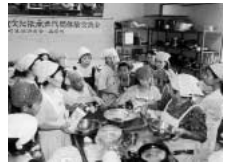
おばあちゃんやお母さんの説明を熱心にきく子どもたち

みて悲しかった」と述べました。 ALTのスチュワートさんは「西原の子ども達を国際的な人にするためにがんばりたい」と決意を述べました。