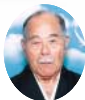
糸数 牛 字翁長449番地