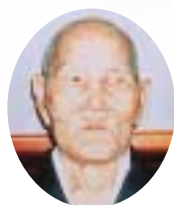
新川 山善 字小那覇290番地の5