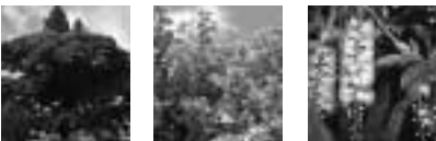
ガジマル ブーゲンビリア サワフジ