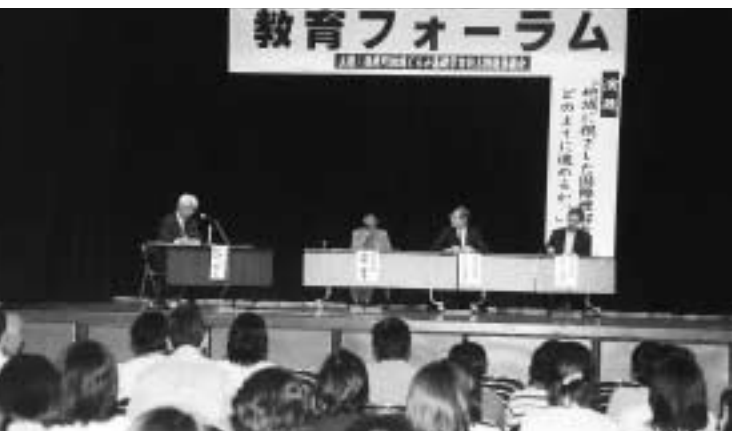
多数の町内学校関係者らが参加した教育フォーラム

さんは「異文化理解というが、違うところだけでなく、共通点を探せば理解しやすい」、「外国人を起用した語学教育のおかげで子ども達が外国人に親しんでいる」、「自国の文化を身につけ、相手に理解させる能力も大切」などの意見を述べ、参加者も子ども達への国際教育をあらためて考えているようでした。