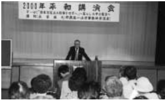
多数の町民が参加した平和講演会

今回のテーマは「日本国憲法 の精神を世界へ」暮らしの中 の憲法」で日本国憲法の三つ の柱である「一」「国民主権」、二 「平和主義」、三「基本的人権