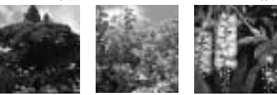
ガジマル ブーゲンビリア サワフジ