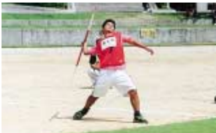
一般男子やり投げ