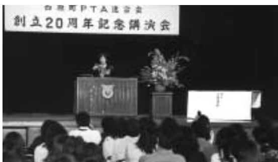
多数の町民が参加した平和講演会

さらに、現代人が持つ不安や欲求不満などについて「何か不満を持つ人は、してもらえなかったことや迷惑をかけられたことを考える時間が長い。幸せになりたいと思いがちで、考えていることは反対のこと。幸せになる視点を変えることが大切」と述べ、「悩んでいる人は、悩みばかりが頭にある。ありがとを一日十回以上言うことなど