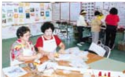
母子コーナー（手作りコーナー）