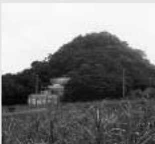
字小波津にある津記武多グスク

県内では約二〇〇から三〇〇ほどのグスクがありますが、西原町内には、 我謝遺跡・津記武多グスク・幸地グスク・棚原グスク・イングスク といった五つのグスクが存在します。津記武多グスクの按司と幸地グスクの按司の争いについての伝説は、この町史だよりでも何度か取り上げたことがあり、みなさんもご存じだと思います。