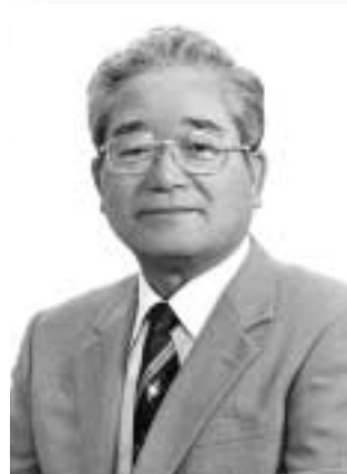
第7代 西原町長となった翁長正貞氏