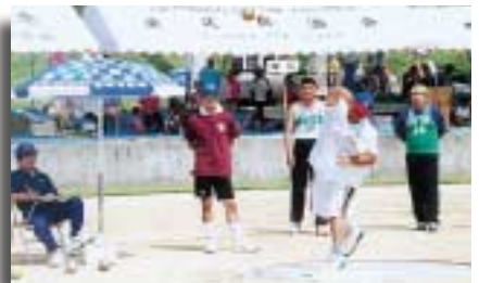
一般男子砲丸投げ