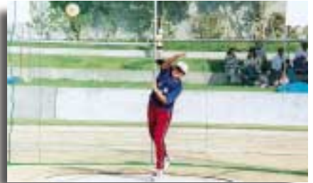
一般女子円盤投げ