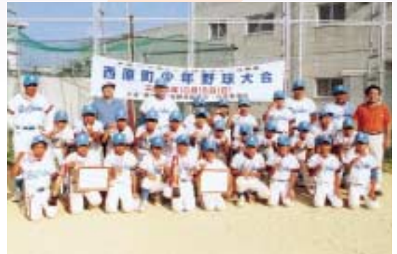
優勝した西原バッファローズ

開会式後は、さっそく熱戦が繰り広げられ、西原バッファローズが6年生、5年生以下ともに優勝しました。