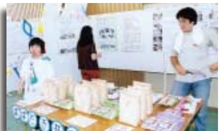
はばたき共同作業所の精米販売