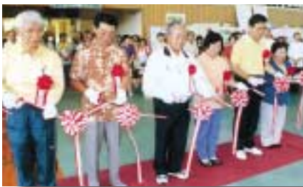
テープカットのようす