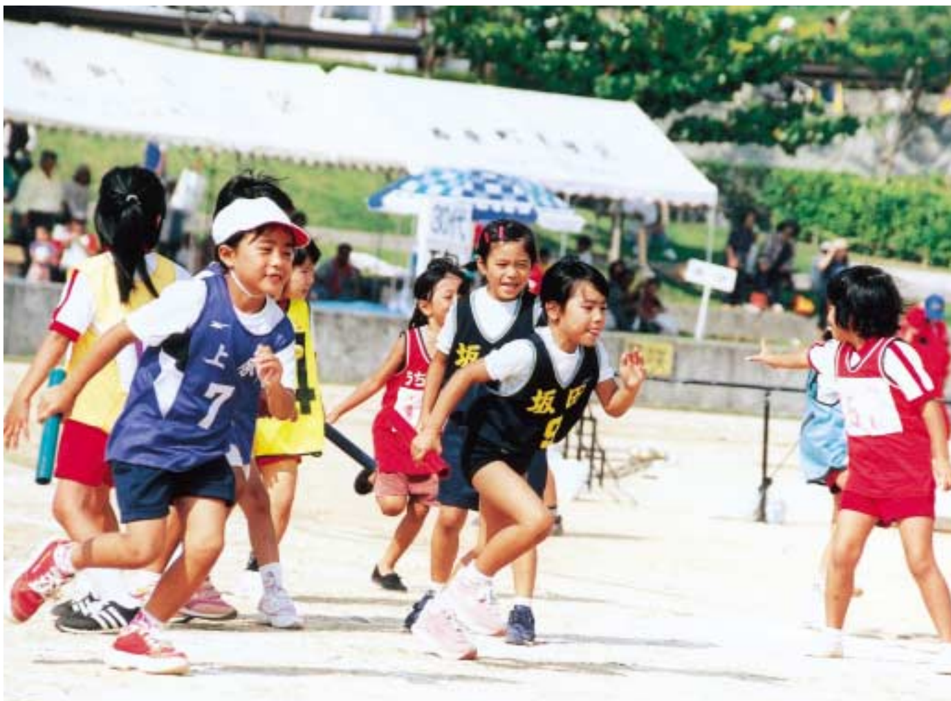
町陸上競技大会 小学生学年別リレー

編集・発行／西原町役場企画財政課（広報係）西原町字嘉手苅112番地 ☎098（945）4533 印刷／グローバル企画印刷（株）