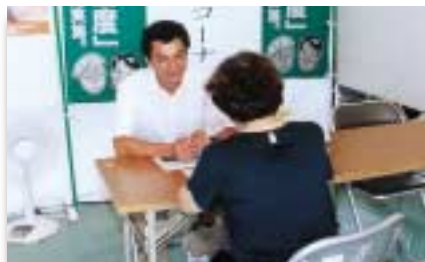
介護相談コーナー