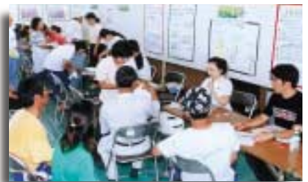
生活習慣病コーナー