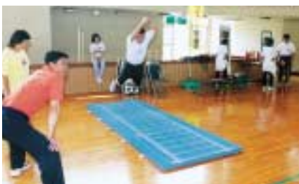
生涯学習課体力測定