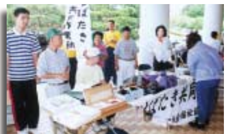
はばたき共同作業所の出店