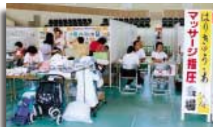
保健課コーナー（はり・きゅう・あんま・マッサージ無料施術）