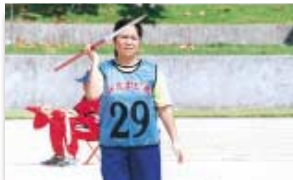
一般女子やり投げ