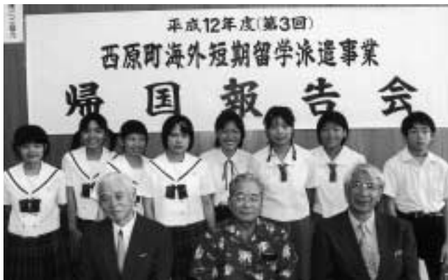
第3回 海外短期留学生のみなさん

今回の派遣された生徒は、五月三十一日に行われた第二回西原町中学校英語ストーリーコンテストにおいて最優秀賞を受賞