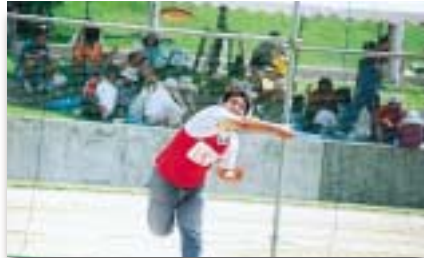
一般男子円盤投げ