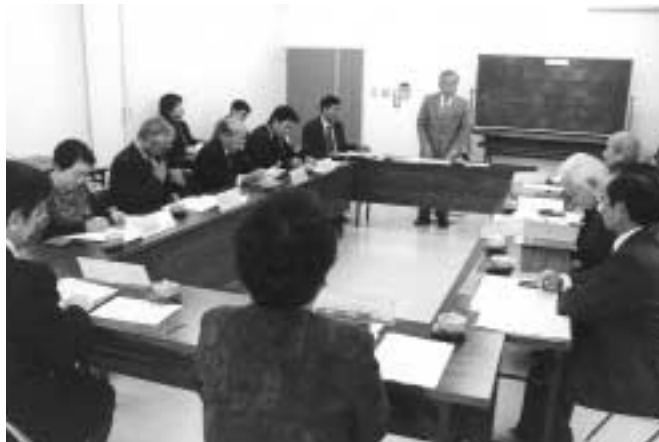
委嘱状交付後、あいさつする翁長町長