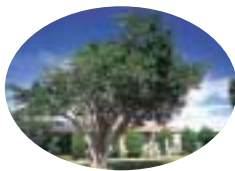
町の木・ガジマル