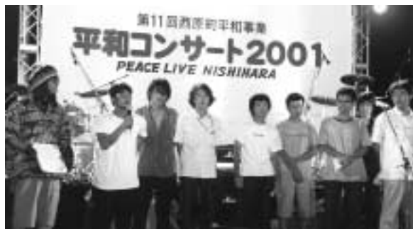
平和メッセージを宣言する各出演者