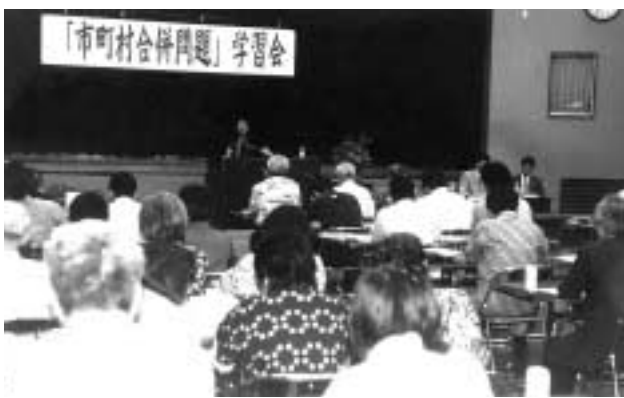
活発な意見がでた「市町村合併問題」学習会

今回の学習会は、今なぜ市町村合併が叫ばれているのか、また町民がどのような視点から市町村合併を考えればいいかなど、今後、本町が市町村合併を考えるための知識や情報を得るための意見交換の場として開催されました。