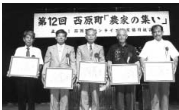
表彰された優良農家のみなさん

引き続き、懇親会では町文化協会による余興があり、参加した農家のみなさんは、日頃の忙しい農業の合間をぬって、しばしの休みを楽