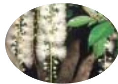
町花木・サワフジ