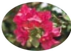
町の花・ブーゲンビリア