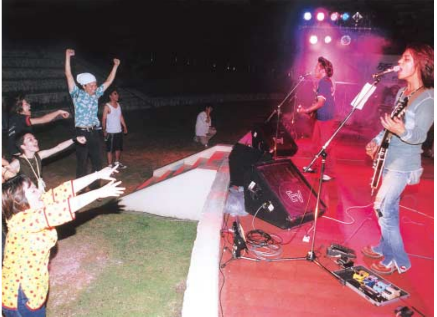
バンド「ジボレーズ」の演奏

編集・発行／西原町役場企画財政課（広報係）西原町字嘉手苅112番地 ☎098（945）4533 印刷／グローバル企画印刷（株）