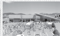
令和2年秋頃オープン予定!