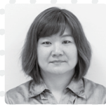
小谷 林 幸地・県営幸地高層・幸地ハイツ