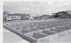
平成30年度1期工事完了 基礎工事までが終わりました。

西原町では、西原町農水産物流通・加工・観光拠点施設について指定管理者の公募を行い、平成30年12月の定例議会で指定管理者として沖縄県農業協同組合(JAおきなわ)が指定されました。それを受け、令和元年5月21日に基本協定を結びました。今後、JAおきなわと連携して西原町を盛り上げていきます!