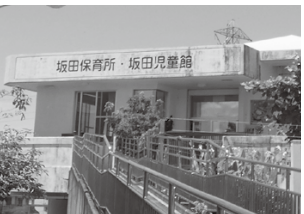
町内でごども誰でも通園制度を利用できる施設(坂田保育所)

その他の質問 ○ごども福祉の構築について ○国産高額医療費手続きの流れについて ○琉球大学病院跡地利用について ○第8回世界のウチナーンチュ大会に向けて