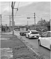
信号機設置するも小那覇交差向けに渋滞が多発

建設部長 町内は昭和56年6月の建築基準法改正後に整備、耐震診断は実施していないとの事。 「沖縄県公営住宅等ストック総合活用計画」に基づき老朽化した県営団地の建て替えを順次進めている。