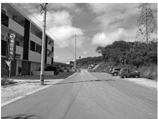
森川翁長線建設予定地

建設部長 森川翁長線は西原西区の区画整理地区を起点として、森川集落の町道森川1号線を終点とした道路であるが、当該道路は沖縄振興公