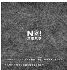
暴力・暴言、ハラスメントにNO!という社会を目指して/日本スポーツ協会

※スポハラ スポーツハラスメント その他の質問 ○職員が安心して働ける職場環境づくりについて ○自主運営の大きな一手、ふるさと納税の寄附拡大について