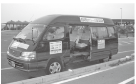
新たな公共交通モード導入とは

対応、自家用車を利用できない町民の日常生活に必要な移動手段の確保を目標とした取組みを予定。 その他の質問 ○下水道事業の整備計画と使用料改定の内容と時期は。 ○子ども、子育て支援制度の支援事業対象への予算配分は。 ○町民交流センター管理運営委託選定作業の進捗状況は。 ○昨年11月14日発生の中城村伊集地内での土砂崩落事故は、西原町内にも被害や影響を及ぼしているが、県との復旧対策の対応は。