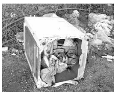
宇地泊川高架橋下の不法投棄

総務部長 本町における不法投棄の現状としては、人目につきにくい山林や農用地に廃家電等の不法投棄が見受けられる。町道、里道の不法投棄については警察へ通報、処分を行っているが、不法投棄の対策としては、不法投