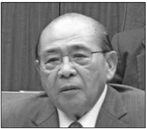
まえさと こうしん 議員 前里 光信

●この一般質問の内容は、会議録(反訳文)に基づいて各議員が質問の一部をまとめ、本委員会が最終確認・編集をしたものです。 ●各議員横のQRコードからその議員の一般質問の動画をご覧いただけます。