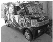
てだこ駅そば高速道路側道の不法投棄車両

棄の多い区域を中心に注意喚起の看板を設置し、平日は環境安全課職員による巡回を行っている。しかし不法投棄の改善には至っていない。