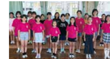
西原東小学校 音楽部