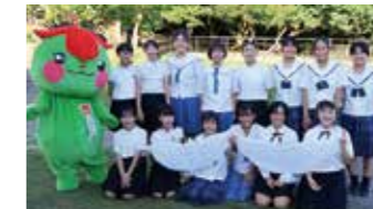
西原町子ども会育成連絡協議会