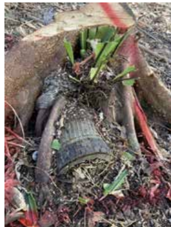
令和6年度に幸地区内で発見された米国製5インチ艦砲弾▶ (長い年月が経ち、周りに大きな木が生えている)

沖縄県にて使用された弾薬量は、約20万トンとされており、多くの不発弾が残された。残された不発弾は、復帰までは住民や米軍によって処理され、復帰後は自衛隊によって処理が続けられているが、その処理には長期間を要すると推定される。本県における不発弾等処理事業で発見される不発弾等の割合は、県内全体の1割以下であり、その他は不発弾等処理事業によらない工事等で発見されている。(R6消防防災年報 抜粋)