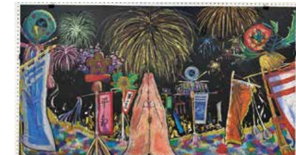
▲令和7年度チョコレートアート展示会の様子