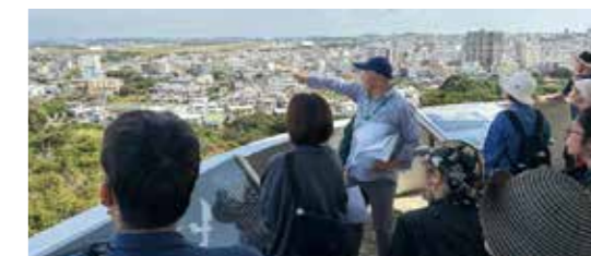
▲令和7年度平和バスツアーの様子