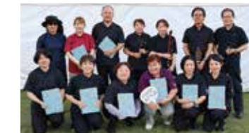
読みあいネットワーク喜楽星7