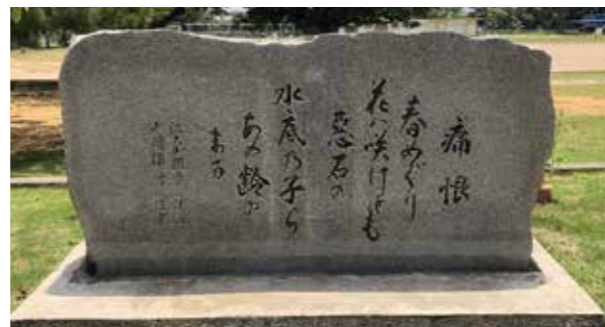
▲古堅国民学校対馬丸遭難学童慰霊碑(読谷村)

【開催期間】5月29日(金)~6月28日(日) 【場所】西原町中央公民館 1階ロビー