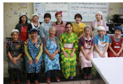
「おいしんぼサークル」の皆さんとアルゼンチン料理「サルサクリオジャ」や「エンパナーダ風餃子」を作りました。

アルゼンチン共和国は南アメリカに位置し、沖縄からは飛行機で35時間ほどかかります。西原村から初めてアルゼンチンへ移民が渡ったのは1909年(明治42年)で、戦前で100人以上の村民が移民しました。その後、1957年(昭和32年)に在亜(アルゼンチン)西原村人会を創立し、これまで西原町との交流を図っています。