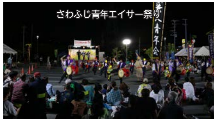
さわふじ青年エイサー祭り