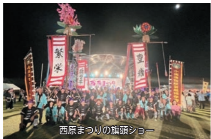
西原まつりの旗頭ショー

地域の文化・芸能は地域を活性 化する宝です。 今後とも地域の文化・芸能が継 承され益々活動が発展することを 願っています。