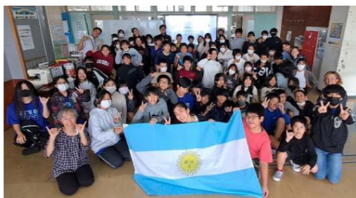
町内小中学校を訪問し、アルゼンチンの言葉や文化を紹介し交流しました(写真は西原東小学校)。