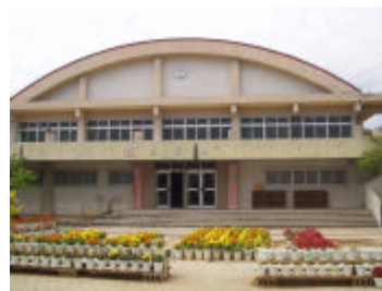
現在の西原小学校体育館