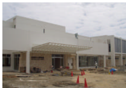
現在の西原町立図書館