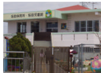
2カ所の町立保育所で実施