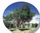
町の木・ガジマル