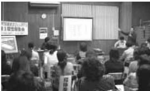
報告を行う西原町役場まちづくり研究会 三期生

行政組織の活性化を図るとともに、明るく、魅力あるまちづくりを推進することを目的に町職員をメンバーに発足した、まちづくり研究会三期生の報告会が、十二月一日に行われ約七十人の職員が参加しました。