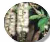
町花木・サワフジ