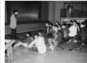
真剣なまなざしで…