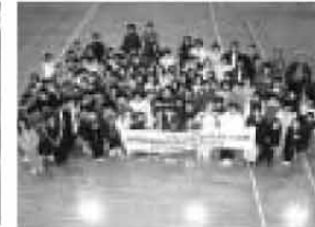
山梨にて…ハイ、チーズ!