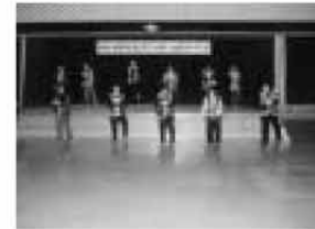
緊張するな～。ドキドキ!

西原町青少年交流事業の一環として県外へ青少年を派遣し、レクリエーション・スポーツ等の交流により相互の友情と連帯の精神を養うとともに、視察研修や体験学習で他県の歴史や文化を学び、心豊かでたくましい児童・生徒の育成を図ることを目的として町内から35名(小・中学校や子ども会・スポーツ少年団)の児童・生徒が山梨県都留市の児童・生徒の皆さんと交流を深めてきました。