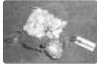
町交通安全母の会から新成人に贈られた交通安全のお守り