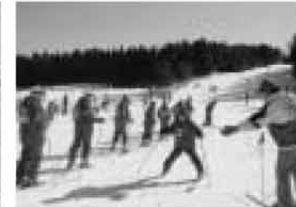
雷だ雷だ!ほら、よそ見をしないで!