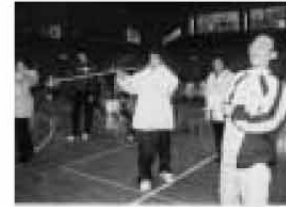
ねらいをさだめて…