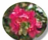
町の花・ブーゲンビリア