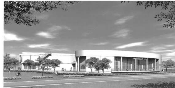
(兼久川側から見た図書館イメージ図)