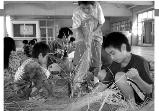
千把こきを使っての脱穀