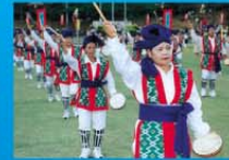
世界2大会制覇の西高マーチングバンド!