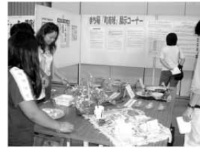
若手町職員のみちづくり研究会「長寿研究班」の展示コーナー

町と町教育委員会が主催する「いきいき健康フェスタ二〇三」が十月十一日に、町民体育館をメイン会場に西原運動公園内で開催され、多数の町民が健康チェックや軽スポーツを楽しみました。 町民体育館内では、体脂肪率や血圧・血糖値測定、無料のはり・灸・あんまマッサージ、介護実技講習会、薬草展示、学校給食の紹介、試食コーナーなどが設けられました。 また、体育館前ではフリーマーケットコーナーが設置され、多くの方々にぎわいました。 町陸上競技場では、スポーツ少年団の体力測定などが行われました。 今回のフェスタには、子供体操サークルや坂田保育園児のエイサーやピエロショーなどが行われ、会場を大いに沸かしてくれました。