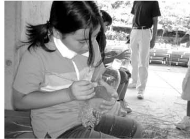
ペットボトルに大きな穴と小さな穴を開け、稲を通して脱穀する