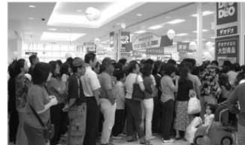
オープニングの10月1日は、各コーナーで長い行列ができた。

営業時間は、午前九時から午前〇時まで。オープニング日となった十月一日は、国道三二九号、県道三八号線を中心に大渋滞となりましたが、翌日からは徐々に落ち着きを取り戻しました。