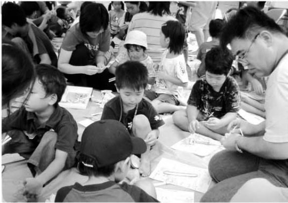
段子で作った玩具づくり

金太郎まつり 坂田小学校 十月十二日、坂田小学校で金太郎まつり（坂田小学校PTA・西原町地域教育連絡協議会坂田校区支部共催）が行われました。 まつりでは、同校体育館の舞台で子どもたちの踊りや一般の空手演舞など多彩な出し物が行われ、広場（ピロティ）では、手作り玩具、水ヨーヨー釣りなどの遊びコーナー、ポップコーンやいか焼きなどの食べ物コーナーが設けられ、たくさんの子どもたちがまつりを楽しんでいました。