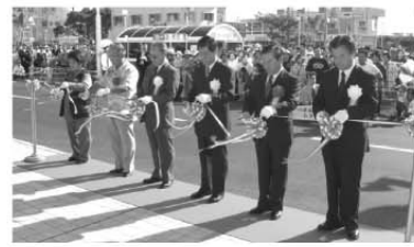
テープカットのようす

県内スーパー最大手の(株)サンエー(宜野湾市、土地哲誠社長)は、十月一日、西原町の中部製糖工場跡地に大型ショッピングセンター「サンエー西原シティ」をオープンさせました。店舗面積は約二千万六百万平方メートルで、具志川メインシティを上回る広さ。テナントは約五十店舗。年間売り上げは約百二十億円を見込んでいます。