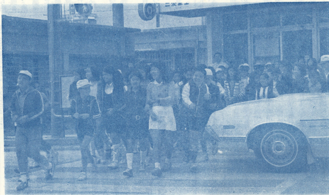
坂田小学校前信号機