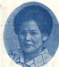
長 中は三 人 日見ぬ 婦 間の桜 城 かな 大 まった