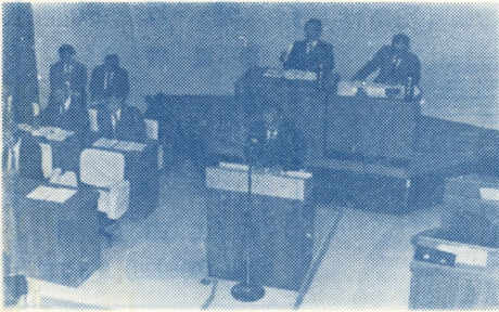
議 会 よ り

受験対象を村内に限定しているの で、みんな知人、友人の関係とあつて、みんなうかぬ顔。