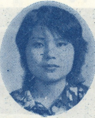
一月十日 五日、午 後二時、 成人式が 始まっ た。