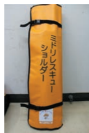
コミュニティ助成事業で整備した資器材 防火服一式8着・ミドリレスキューショルダー5個