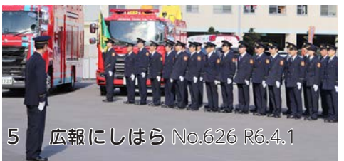
5 広報にしはら No.626 R6.4.1

令和5年度に実施した火葬場等整備基礎調査の結果を踏まえ、町としての火葬場（公営墓地）に関する整備