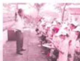
ニシバル歴史の会から説明を受ける様子