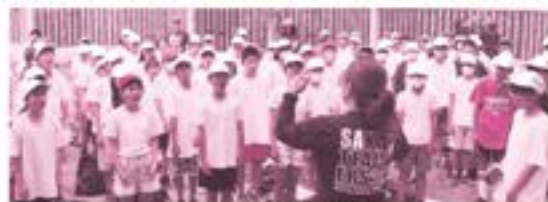
「月桃」を合唱する様子