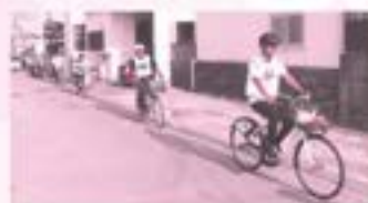
電動自転車ですいすい

各スポットでは、ニシバル歴史の会のガイドによる説明が行われ、西原の歴史文化の理解を深めました。