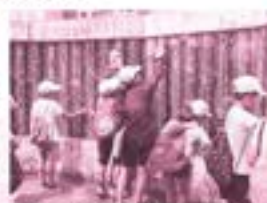
戦没者刻銘碑を清掃する様子