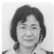
伊良部 典子 池田・幸地・幸地 高麗・幸地ハイツ