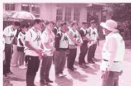
ニシバル歴史の会から説明を受ける様子(西原の塔)

令和5年度の町役場新採用職員15人を対象に、シェアサイクルを活用して町内の戦争遺跡・歴史文化スポットを巡る職員研修に取り組みました。