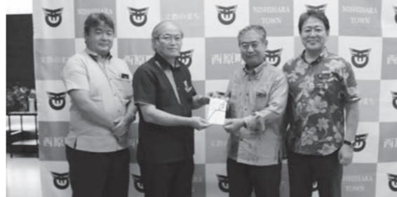
寄附者: 新中糖産業株式会社(上原周夫代表取締役社長) 寄附額: 30万円 使い道: 町立小中学校へ5万円分の図書