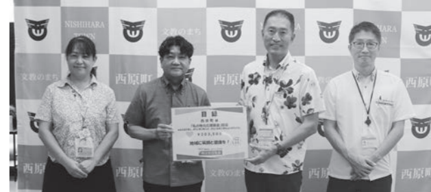
寄附者: 明治安田生命株式会社(腰川藤雄沖繩支社長) 寄附額: 203,500円 使い道: 町長が必要と認められる事業