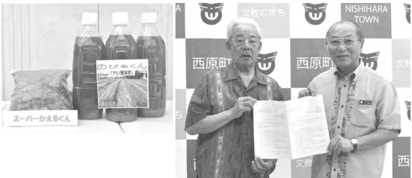
翁長理事長(写真左)と上間町長