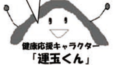
健康応援キャラクター「運五くん」