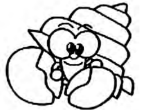
●中城湾南部流域下水道促進協議会キャラクター(オカヤドカリ)

○ 下水道に関するお問い合わせは 上下水道課 下水道係 ☎945-4934 (内線605・606) まで