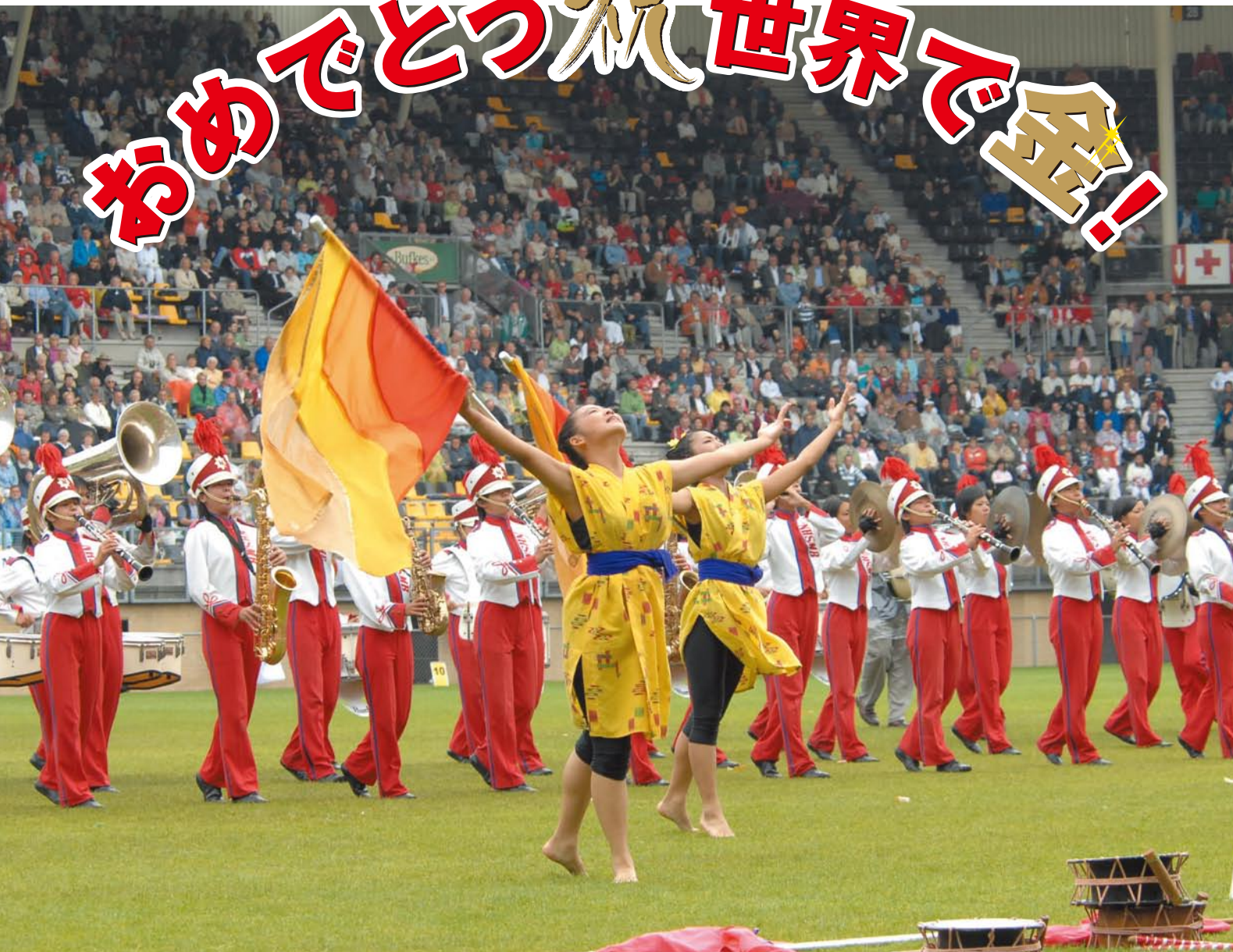
世界大会での西原高校マーチングバンド部の演技