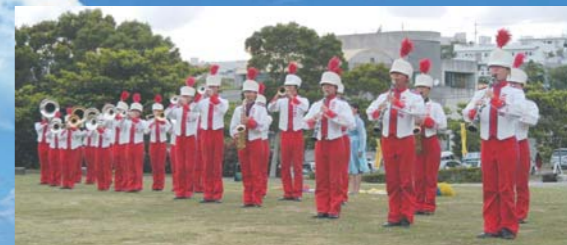
西原高校 マーチングバンド部