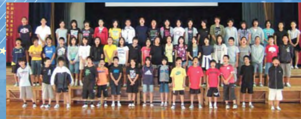
西原東小学校6年生