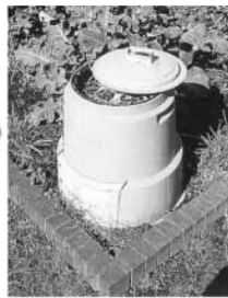
生ゴミから、おいしい野菜もできます (手前の容器がコンポスター)