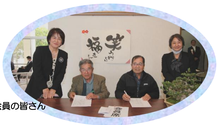
受付の会員の皆さん