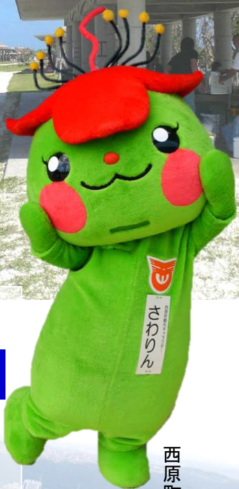
西原町 観光キャラクター 「さわりん」