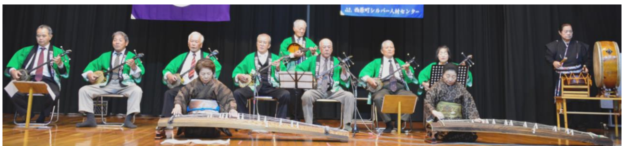
厳かに民謡を奏でる皆さん