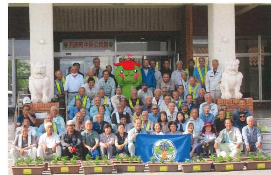
設立30周年記念事業「花いっぱい運動」