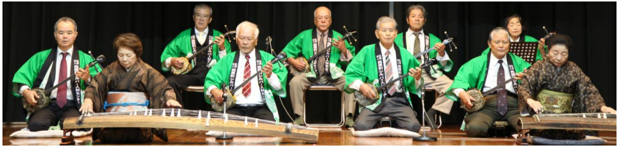
幕開け(かぎやで風節・恩納節・ごえん節)