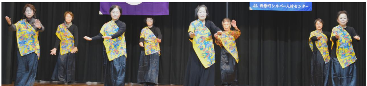
艶やかに舞う女性会員の皆さん