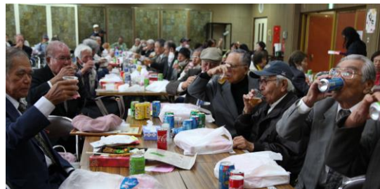
30周年を祝して「乾杯！」