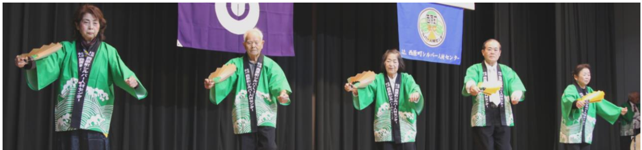
かぎやで風節で祝う30周年