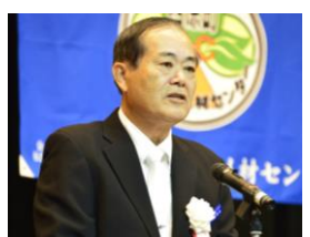
西原町長 崎原盛秀