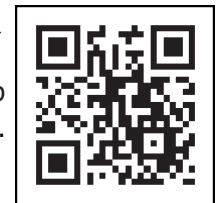
Código QR de navegación de la vacuna contra el coronavirus