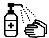
Desinfectese bien los dedos y las manos con alcohol

Evite las "3C (lugares concurridos, encuentros cercanos y espacios cerrados)"