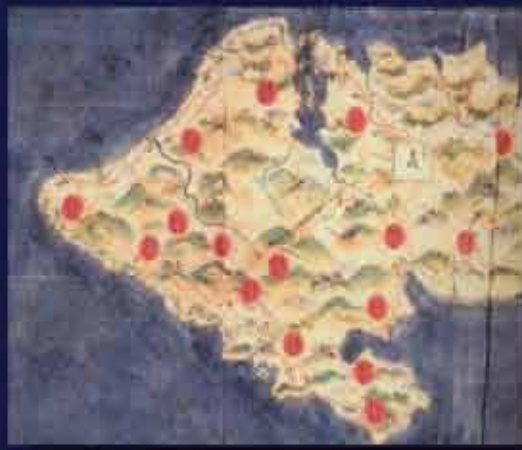
正保国絵図 江戸時代、徳川幕府は全国的な国絵図を、慶長・寛永・享保・元禄・天保の5回調製。「琉球国絵図」は享保以降の3回分が調製された。