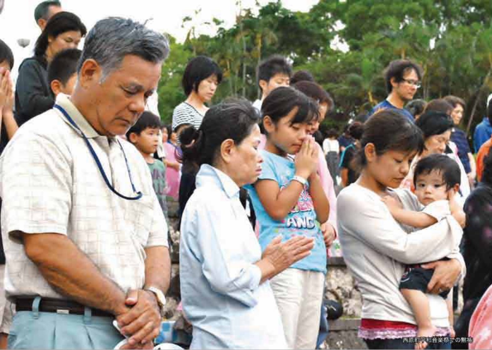
西原町平和音楽祭での黙禱