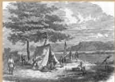
ペリー艦隊の随員が描いた木版画 タイトルは「探検家たち一琉球一夜営」。随員たちがテントを張って夜営している広場は、字小那覇川の上ヌ松原(イヌヌマージュ)だと見られている。