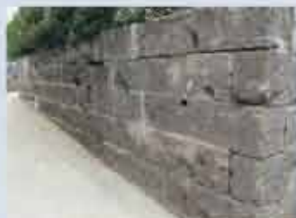
宇小波津 弾痕のある石塀