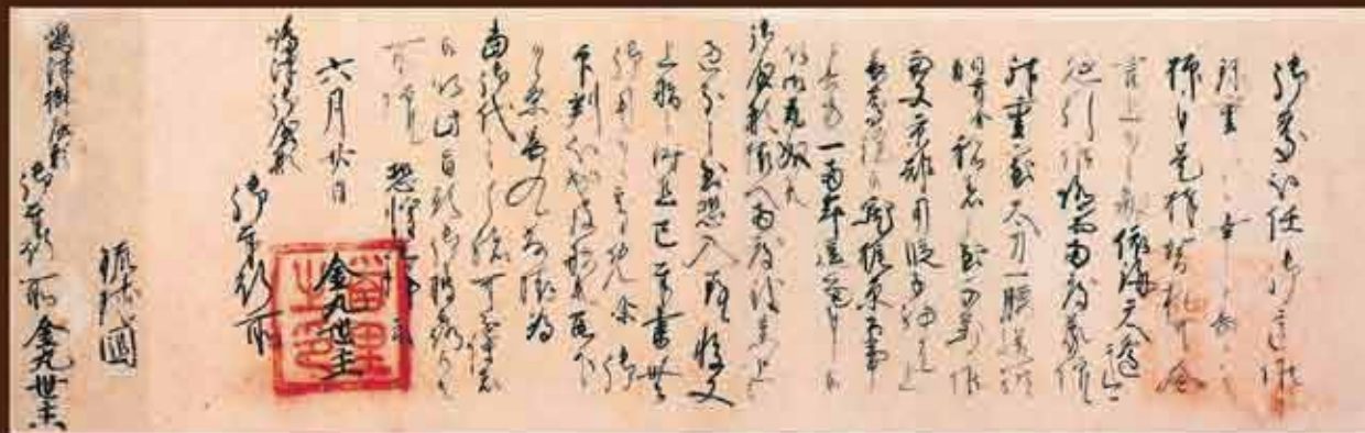
1471(尚円2)年琉球国金盛丸主書状 前年王位に就いた金丸(尚円王)が島津氏に宛てた書状で、「琉球国」の表記が見える。年代は特定できないが、尚円王の在位が1470-76(文明2-8)年なのでその間に書かれたものと思われる。