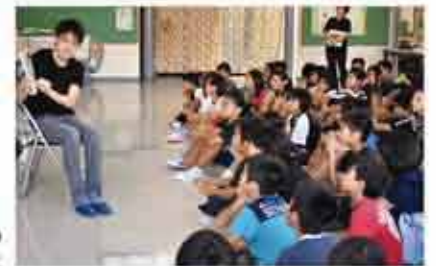
西原南小学校の読み聞かせ

町立中学校の2年生全員が4日間学校を離れ、職場体験学習「チャレンジウィーク」を行っています。「チャレンジウィーク」には町内約100の各店舗や事業所などが協力し、生徒たちに仕事のやり方や社会人としての心構えを教えます。また、町立小学校の6年生が親の職場等で1日職場を体験する「チャレンジデー」を実施しています。