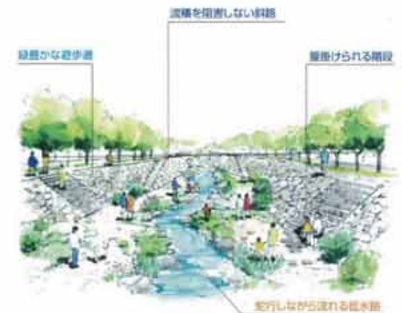
小波津川河川改修事業

西原西地区は本町の北西部に位置し、県道沿線に住宅と商業施設が立地、その後背地には農地、傾斜地には原野が多く存在します。近年、人口流入が集中し、県道の整備計画もあることから、都市基盤の整備、良好な住宅地の確保と賑わいのある商店街及び地域コミュニティの向上を図っています。(施工期間は平成18年度から28年度まで予定)