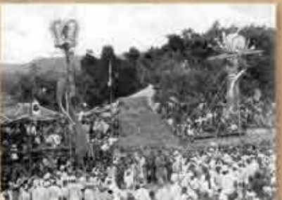
1937(昭和12)年 戦前の字小那覇の綱引き 小那覇では綱引きはウファチジナ(お初綱)とかチフィチヌウグワン(綱引きの御願)とか呼び、旧暦6月25日に行われた。綱引き行事は現在も伝承されているが、戦前の方が盛大で、より生活に密着していたことがうかがえる。