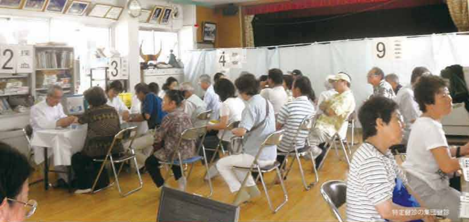
特定健診の集団健診