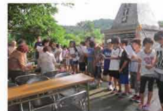
小波津自治会慰霊祭

国際的視野を広めるとともに、海外青少年との友情を深め、国際性を身につけ、21世紀の国際社会に対応できる青少年の育成を図るため、町内中学2年生を対象にハワイへの留学派遣を実施しています。