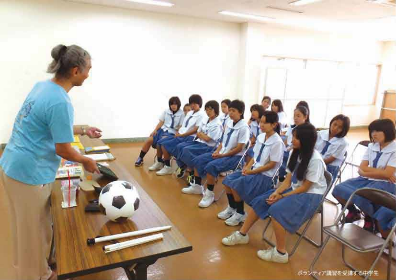
ボランティア講習を受講する中学生