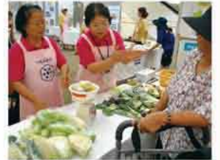
食生活改善推進員