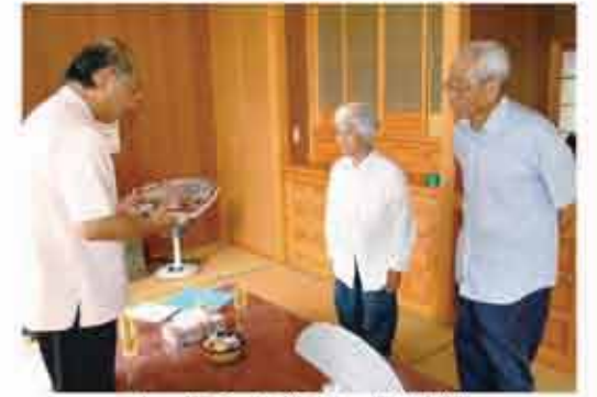
トーチカ・カジマヤー慶祝事業

障がいを持つ町民が暮らしやすい社会を目指して、生活支援の充実強化や社会参加の促進に努めています。