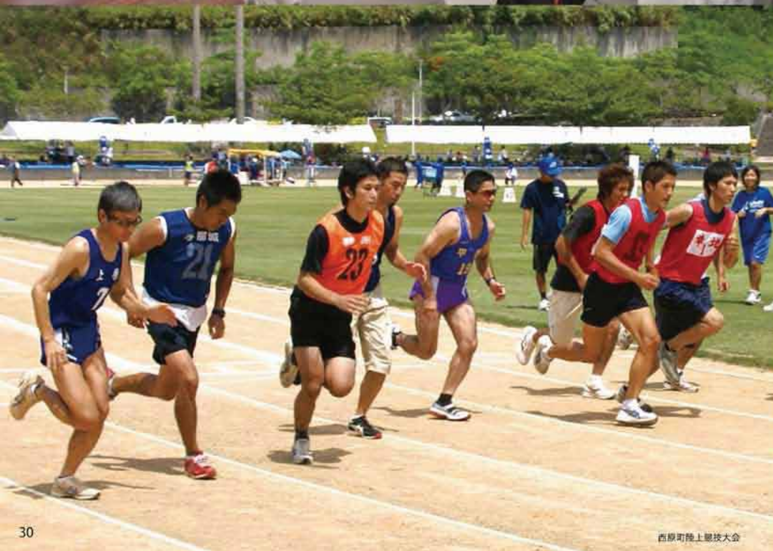
西原町陸上競技大会