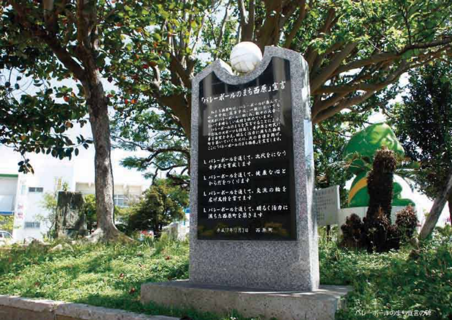
バレーボールのまち宣言の碑