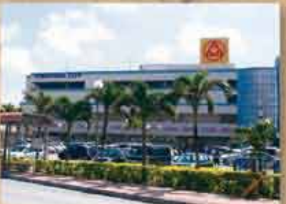
発展する町 西原の産業を長年支えてきた製糖工場の跡地に大型ショッピングセンターがオープンするなど、まちの発展は時代とともに変化し続けている。今後も道路事業や区画整理事業などの進捗に伴い、発展を続ける。