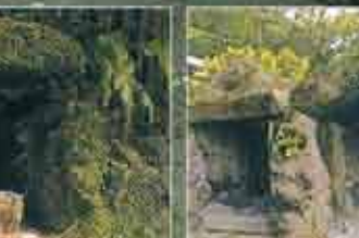
7) アガリーヌウビシル