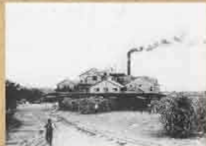
1932(昭和7)年 沖縄製糖株式会社西原工場 台南製糖(株)が社名変更してできた会社。台南製糖(株)は1917(大正6)年、その前年設立の沖縄製糖(株)(名称は同じだが別会社)と沖台拓殖製糖(株)が合併してできた製糖会社である。