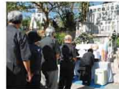
西原町戦没者追悼式

毎年6月23日に開催。戦争を風化させないため、反戦意識の再確認と、音楽文化を通して平和と命の尊さを考える機会を図ります。