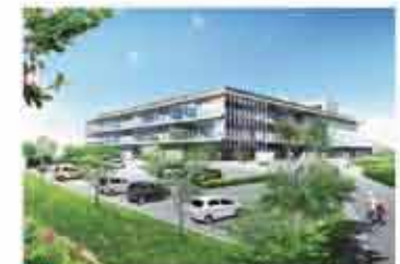
1 西原町新庁舎完成予想図