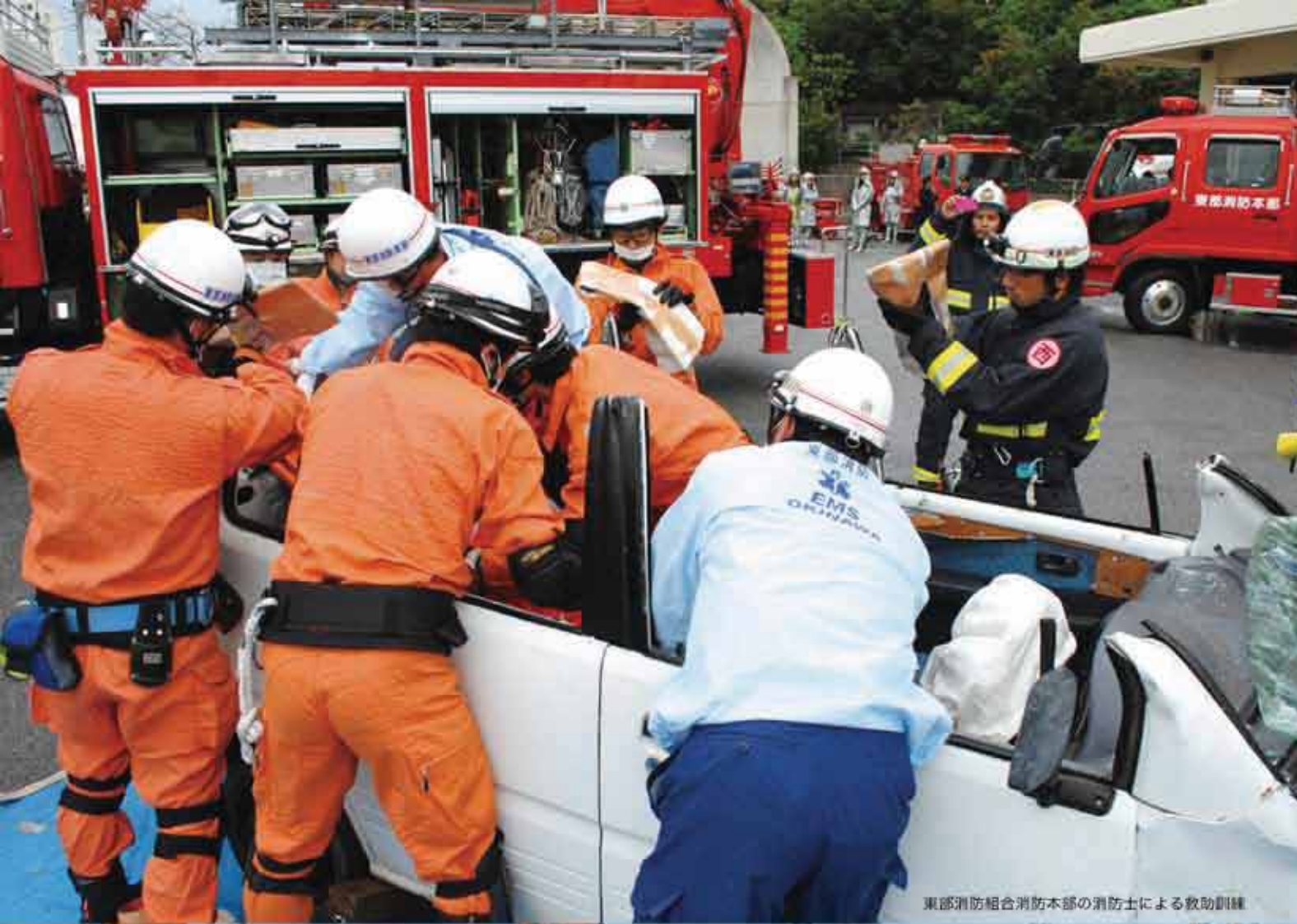
東部消防組合消防本部の消防士による救助訓練