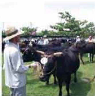
西原町畜産共進会