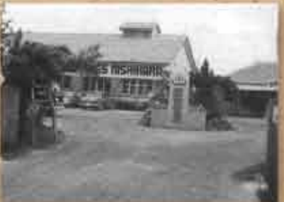
1968年(昭和43) 西原温泉 1957(昭和32)年、ボーリング中に温湯水が湧き出し、調査の結果、アルカリ性温湯泉であることが分かった。沖縄では数少ない温泉施設として整えられた。