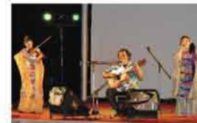
西原町平和音楽祭