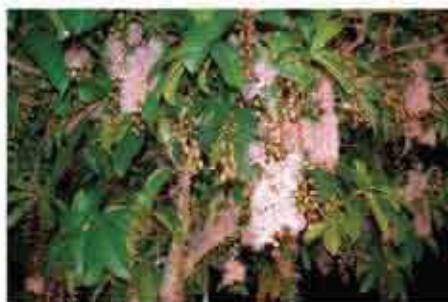
町花木 サワフジ(さがりばな)

3 人の和かたく 結び合い めざす理想の まちづくり 歴史にかおる ふるさとに 文教の鐘 鳴りわたる ああ 西原は わがまちは 栄え果てなく 伸びるまち