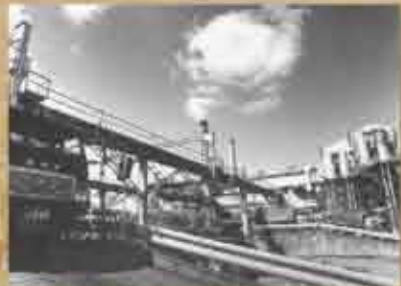
1994(平成6)年 翔南製糖株式会社 西原工場(旧中部製糖株式会社 第一工場) 同工場は長年にわたって西原の産業だけでなく、産業全体を牽引してきた。