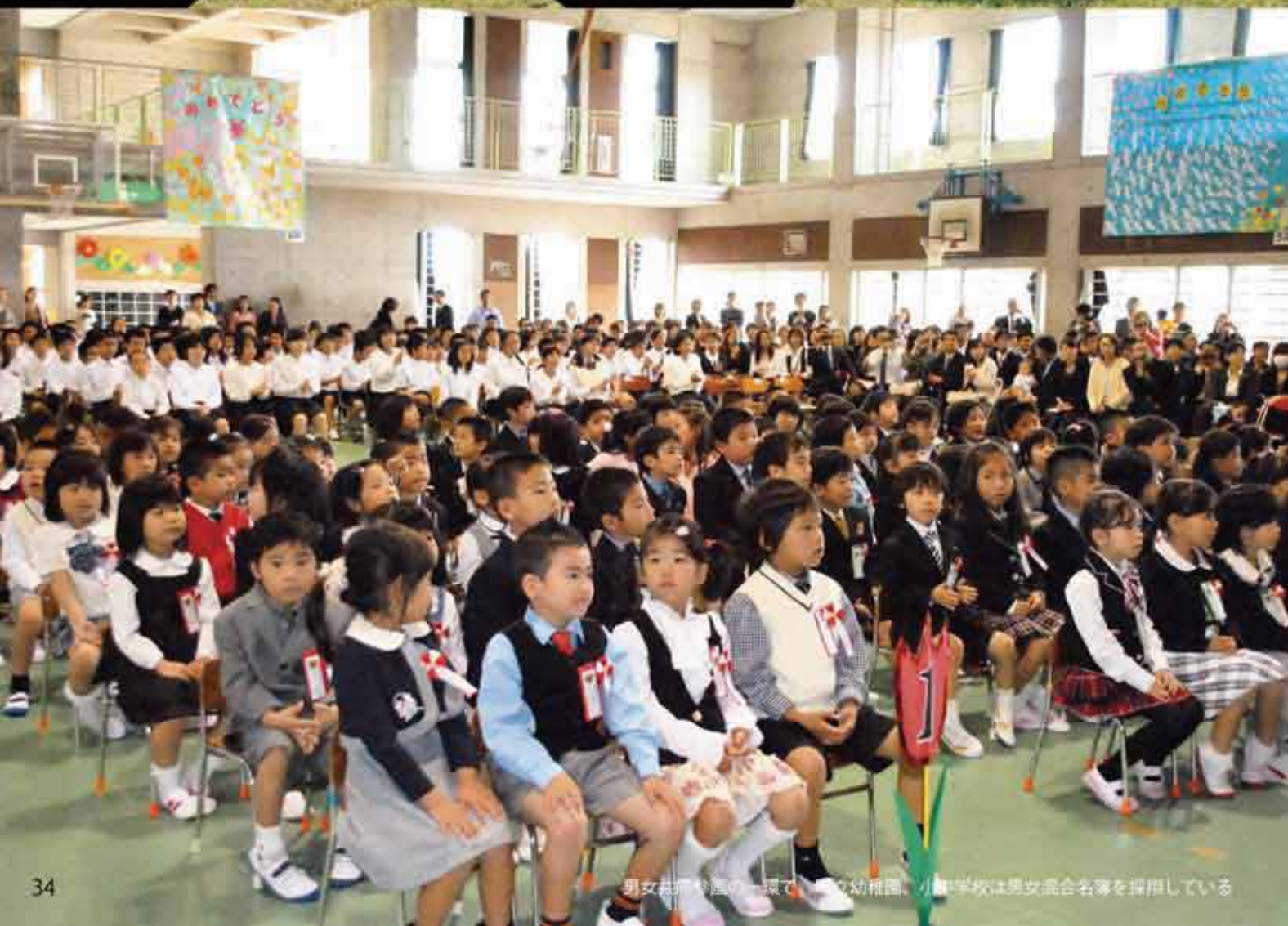
男女共同参画の一端で、幼稚園、小中学校は男女混合名簿を採用している