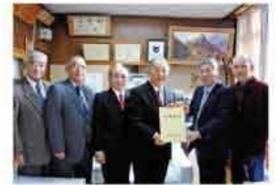
小波津自治会の字誌「小波津誌」

In pursuit of a dynamic and open local community, each residents association undertakes independent community activities. In addition, each district carries out various projects with the aim of passing on and developing local traditions and culture.