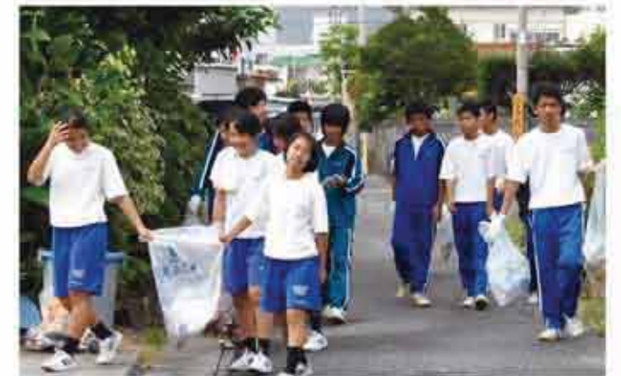
西原東中学校ボランティア清掃