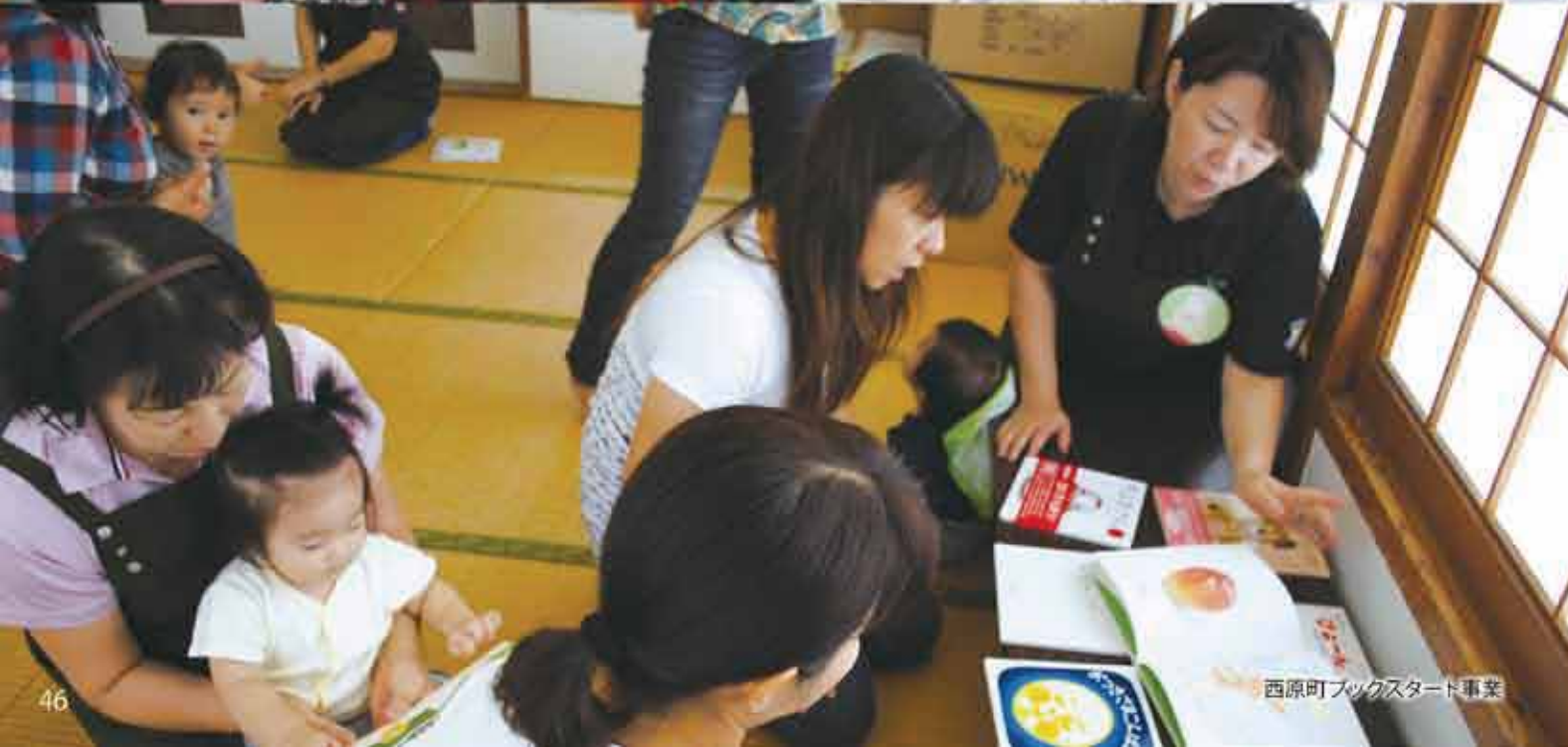
西原町ブックスタート事業