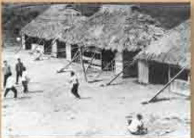
1959(昭和34)年 字翁長の元西原国民学校敷地に新築移転したころの西原中学校