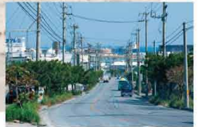
小那覇工業専用地域