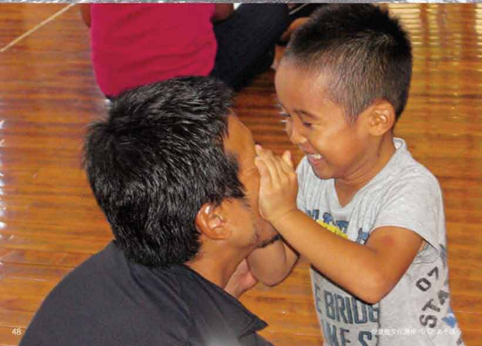
児童館文化講座のこいのぼり