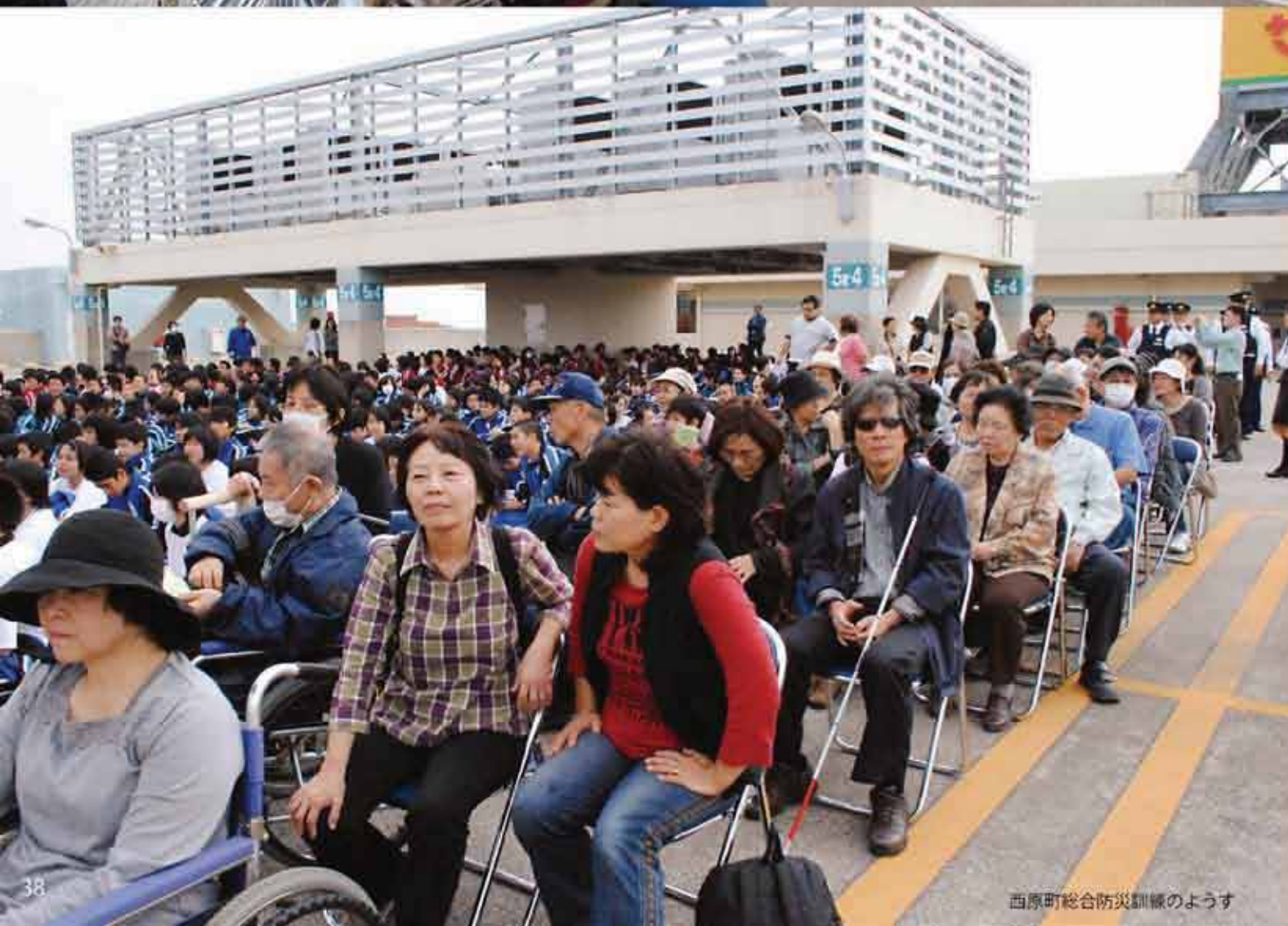
西原町総合防災訓練のようす