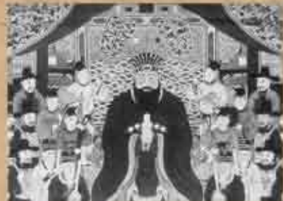
尚円王御後絵 御後絵(おごえ、方言ウグイ)とは死後に描かれた国王の肖像画。この尚円のものももっとも古い。制作年代は不明。