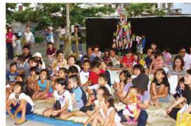
読みきかせイベント「あつとーめーのささやき」