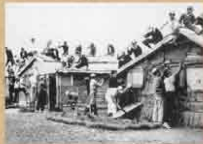
1953(昭和28)年 西原中学校(現・西原小学校敷地内)の校舎修理作業 お互いに協力しながら校舎の修理にあつている生徒たちの表情は明るい。戦後の校舎は、空き地を利用した青空教室から始まった。