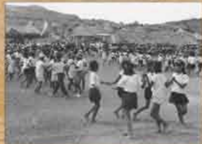
1947-51(昭和22-26)年 坂田初等学校時代の運動会