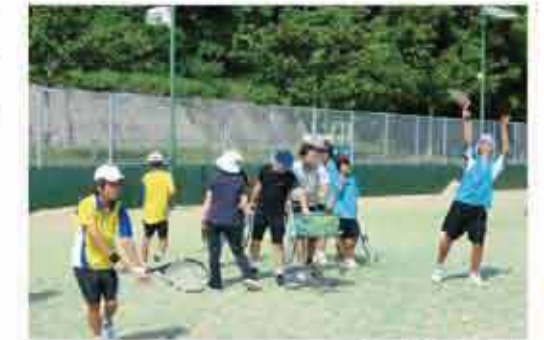
西原町民テニスコート

As main sports activity facility, Nishihara Sports Park is provided with a public gymnasium, athletics stadium, sunset plaza, park golf course, tennis courts and other facilities to promote and maintain the health of residents. In addition, schools and sports facilities are open to the public, and various sports classes, leadership courses and public sports events are held.