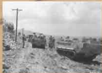
1945(昭和20)年 字小那覇 雨でぬかるんだ道路 西原村一帯を占領した米陸軍部隊が上陸後南の方向に進軍する。左手奥の山は運玉森。