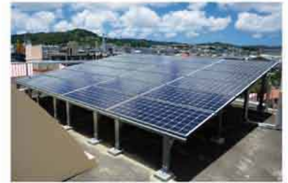
太陽光発電パネル

下水道の普及は私たちの生活環境の向上、公共用水域の水質保全につながります。本町の公共下水道は平成8年に供用開始し、整備区域の拡大と接続率向上に取り組んでおり、今後も下水道への理解を広め、より一層快適な生活環境づくりに努めていきます。