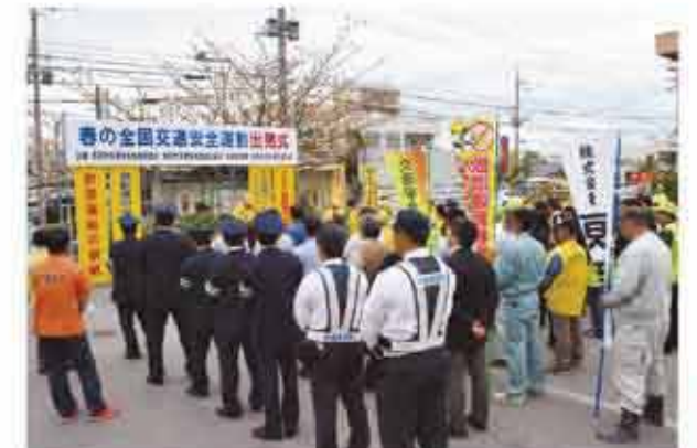
春の全国交通安全運動出発式