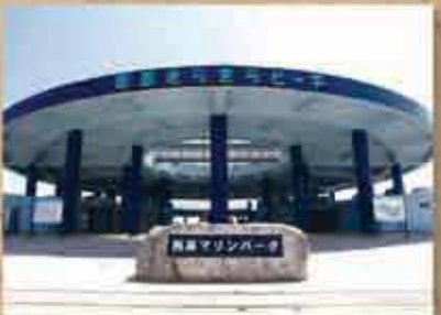
マリントウン東崎 西原と那覇地区の活性化のため、沖縄県、西原町、与那原町が共同で海辺のアニティー豊かなまちづくりを推進する「中城湾マリントウンプロジェクト」によって造成された。ビーチが整備された西原マリントウンをはじめとした緑豊かな公園、住宅や工業地域などが整備された。