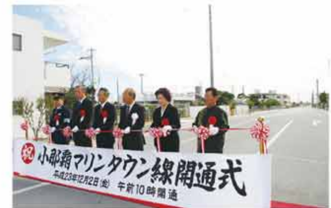
町道小那覇マリントウン線開通式