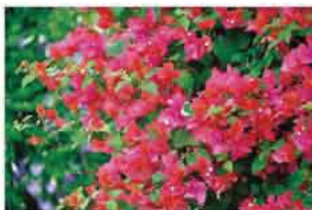
町花 ブーゲンビリア

2 西原富士を仰ぎ見る 眉に希望の 陽がおどる 働く汗に こたえつつ 豊かに育つ さとうきび ああ 西原は わがまちは 若い息吹が はずむまち