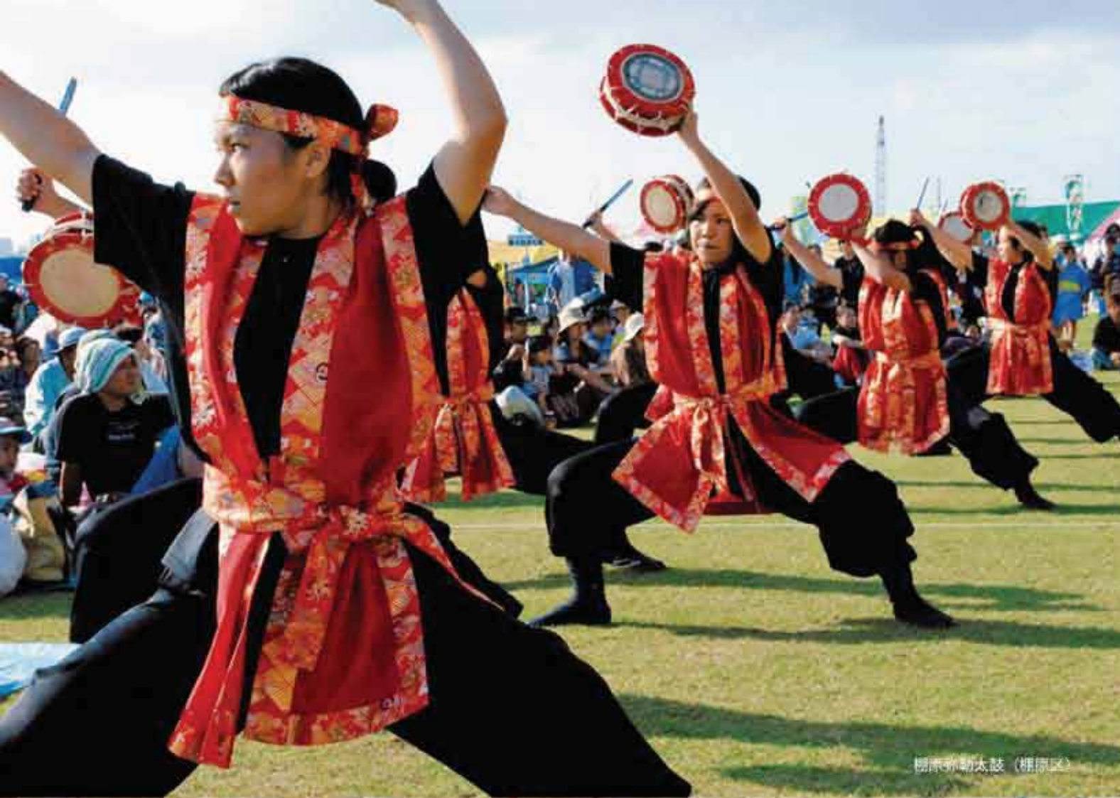
榎原神楽太鼓（榎原区）