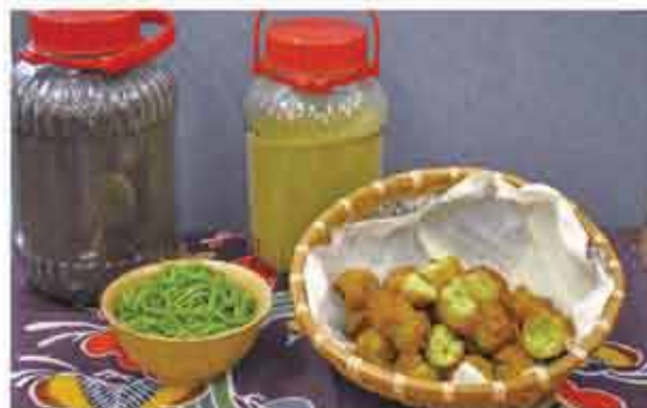
耕作放棄地解消対策事業で開発した加工品