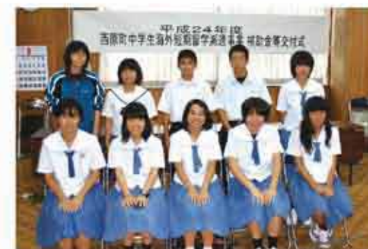
中学生海外短期留学