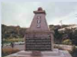
小波津戦没者慰霊碑