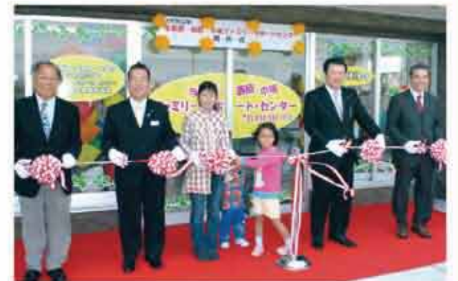
ファミリーサポートセンター開設