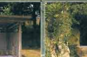
6) イリーヌウビシル