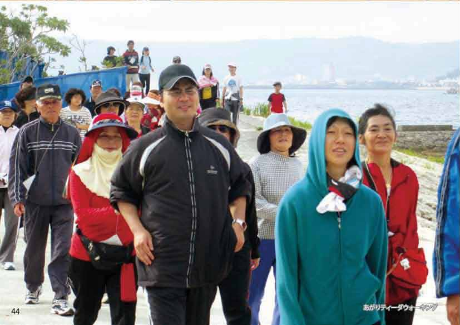
あがりティーダウニング