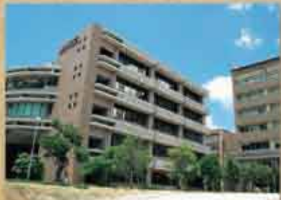
琉球大学 1950(昭和25)年、首里城跡に開学。1979(昭和54)年に現在の字小那覇に移転した。県内唯一の国立大学法人。