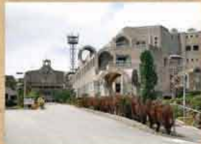
沖縄キリスト教学院大学・同短期大学 1959(昭和34)年、那覇市首里に開学。1989(平成元)年に現在の字小那覇に移転。開学当初は短期大学のみだったが、2008(平成18)年4月に沖縄キリスト教学院大学が開学した。