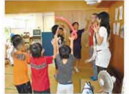
大学生ボランティア主催のイベント