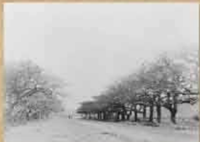
1909-10(明治42-43)年ごろの我謝馬場 馬場は幅約14m、全長約330m余。戦前は見事なウッドシーサー並木で有名だった。ここで原山勝負・大綱引き・読馬・小学校の運動会などが行われ、村の公共広場として使用された。