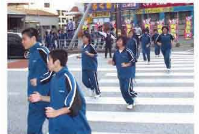
西原東中学校避難訓練