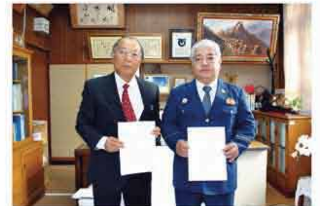
暴力団排除を目指し、警察と連携

東日本大震災を契機に防災への関心が高まる中、災害から町民の生命や財産を守るため、平成25年3月に新しい地域防災計画を策定し、計画に基づいた災害への備えや災害対策を実施しています。また、災害時に搬送が必要な住民を支援する「災害時要援護者リスト」を整備しています。