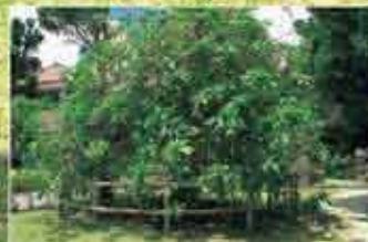
1) サガリバナ (さわふし)