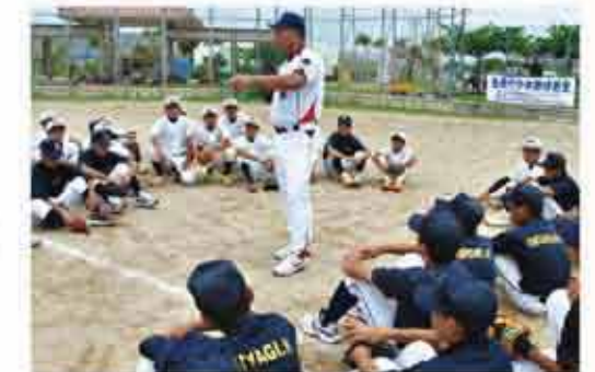
元プロ野球選手による野球教室