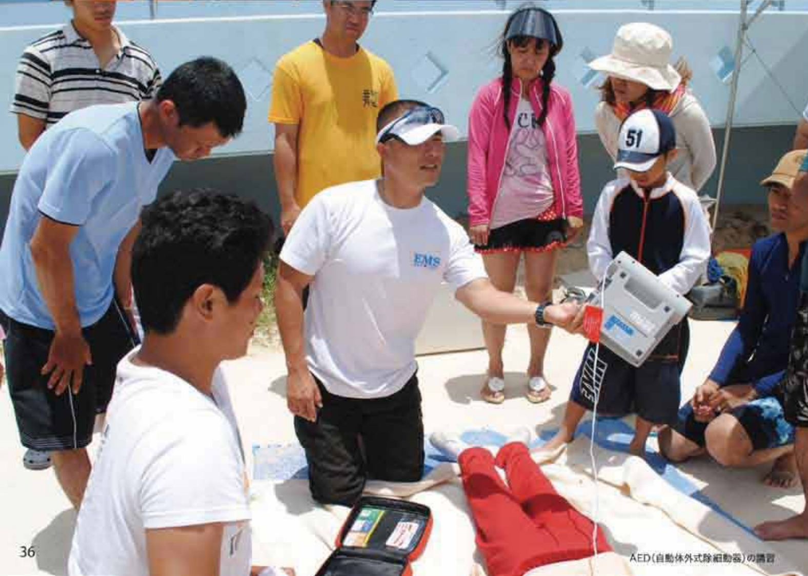
AED(自動体外式除細動器)の講習