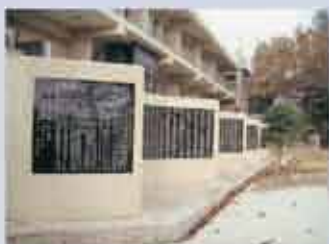
西原町地元住民戦没者刻銘碑