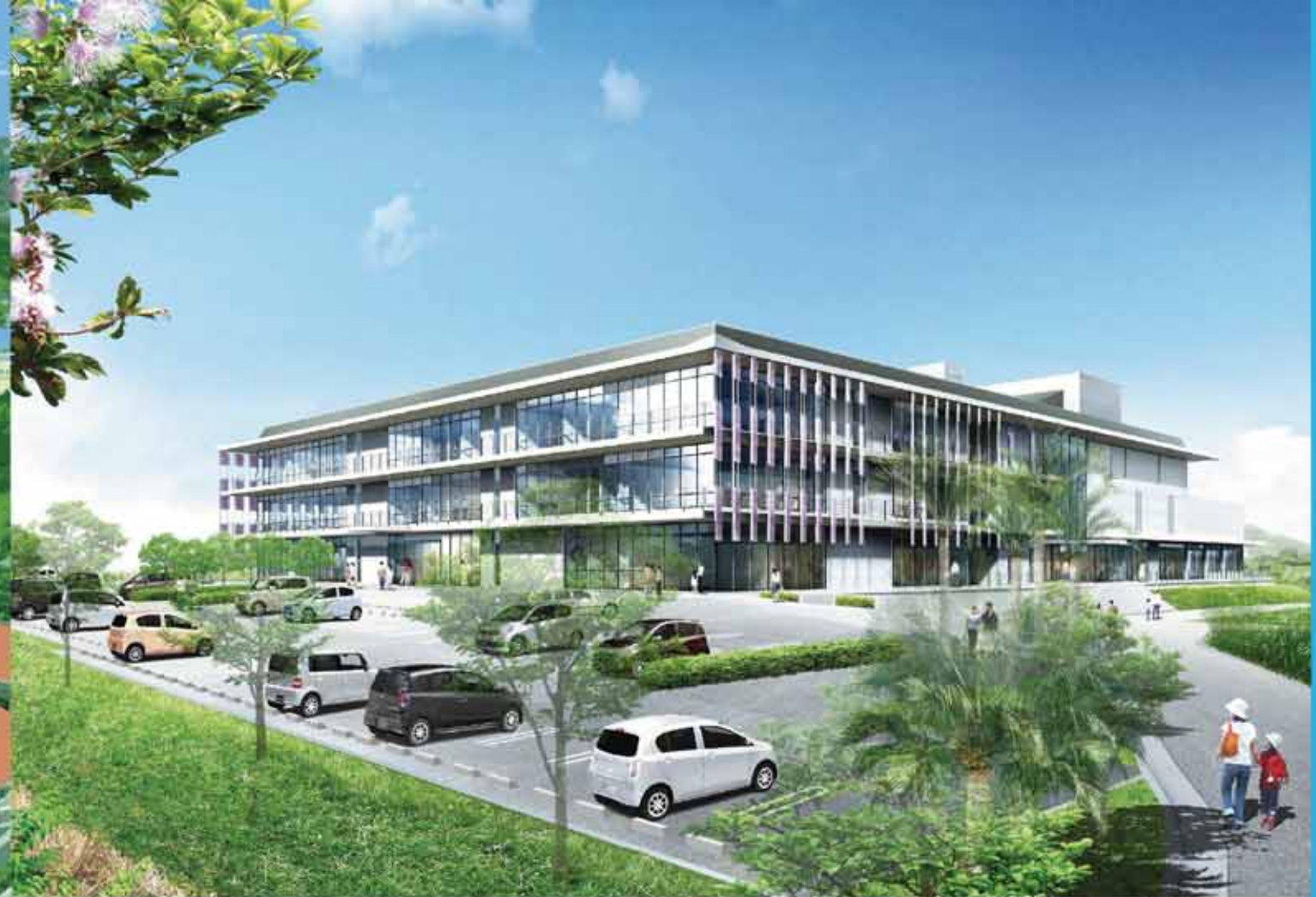
西原町庁舎等複合施設は2014年完成予定