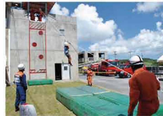
東部消防ファイヤーフェスティバル救助体験

In order to achieve a safe and secure community, we are liaising with various related agencies including the police and fire department.