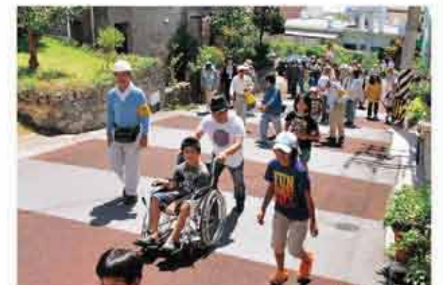
西原台団地防災訓練