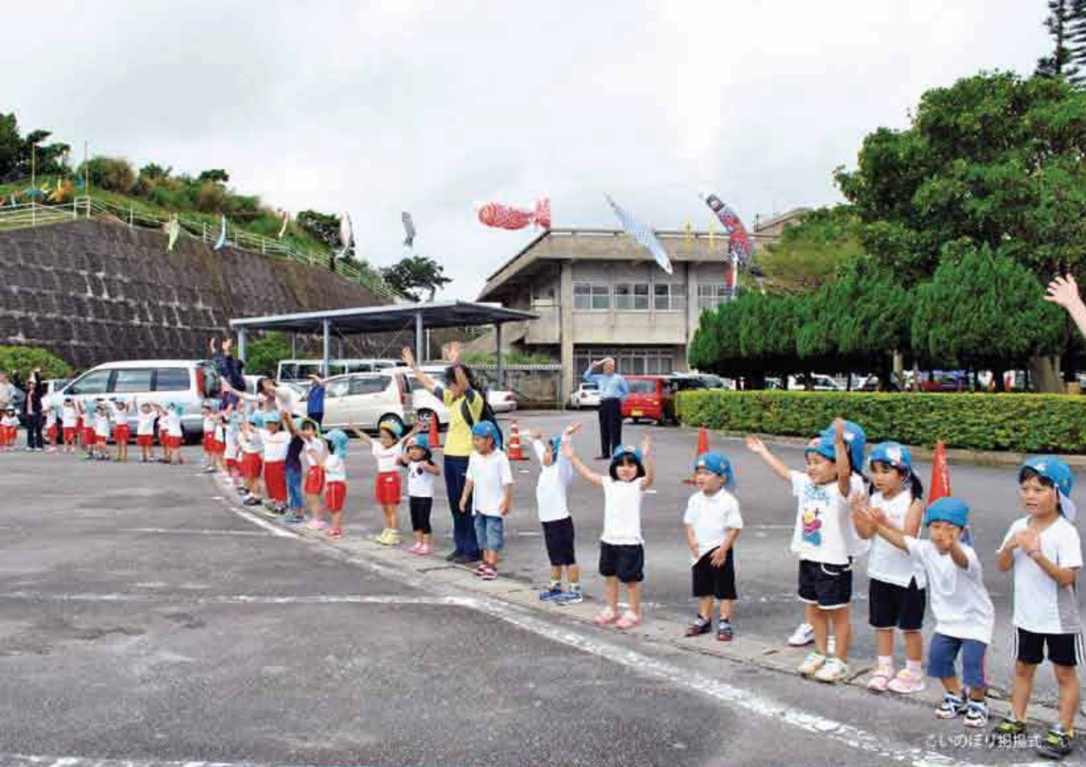
こいのぼり掲揚式