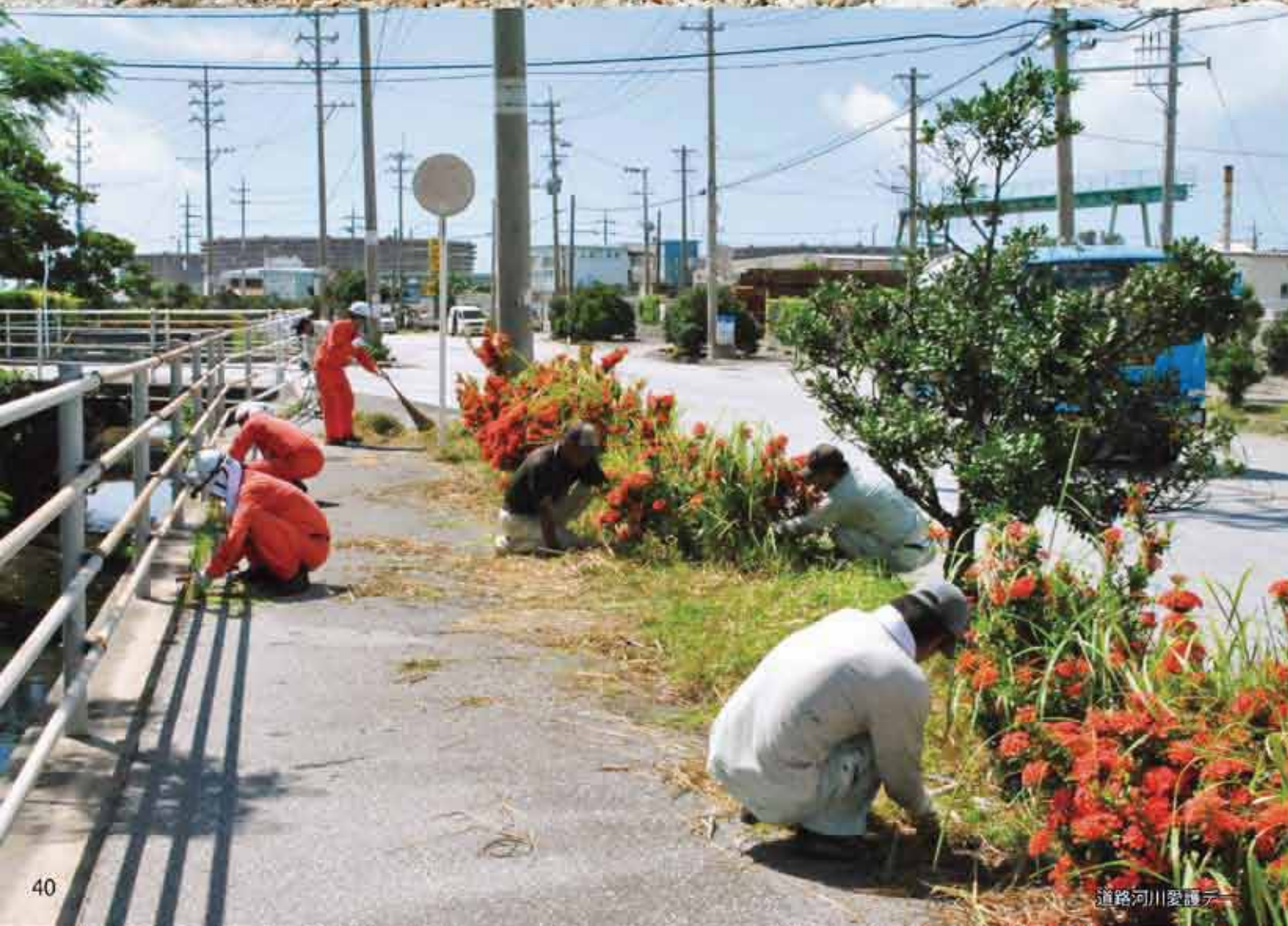
道路河川愛護デー