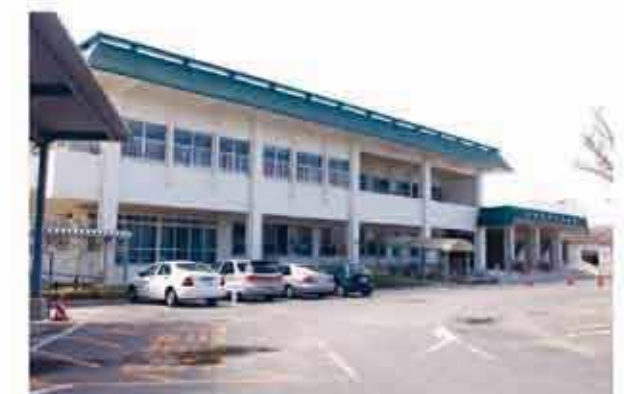
西原町中央公民館

利用者は県内でも上位に入る西原町立図書館。生涯学習の拠点として多くの町民に利用されており、利用者のニーズに応えられるよう、資料の整備を進めています。