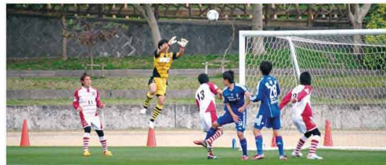
西原町民陸上競技場で行われたサッカーの試合