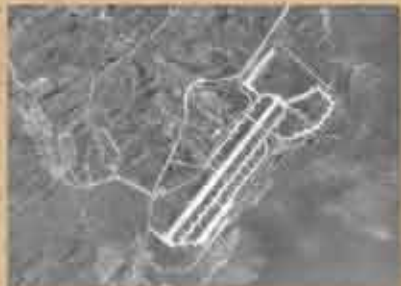
1945(昭和20)年12月10日 米軍が撮影した「与那原飛行場」 旧日本軍「沖縄東飛行場」だった同飛行場は字小那覇に作られた。沖縄に上陸した米海軍に收容され、専用飛行場として補修。滑走路を6500×150フィート(2130×45m)に拡張して開設された。