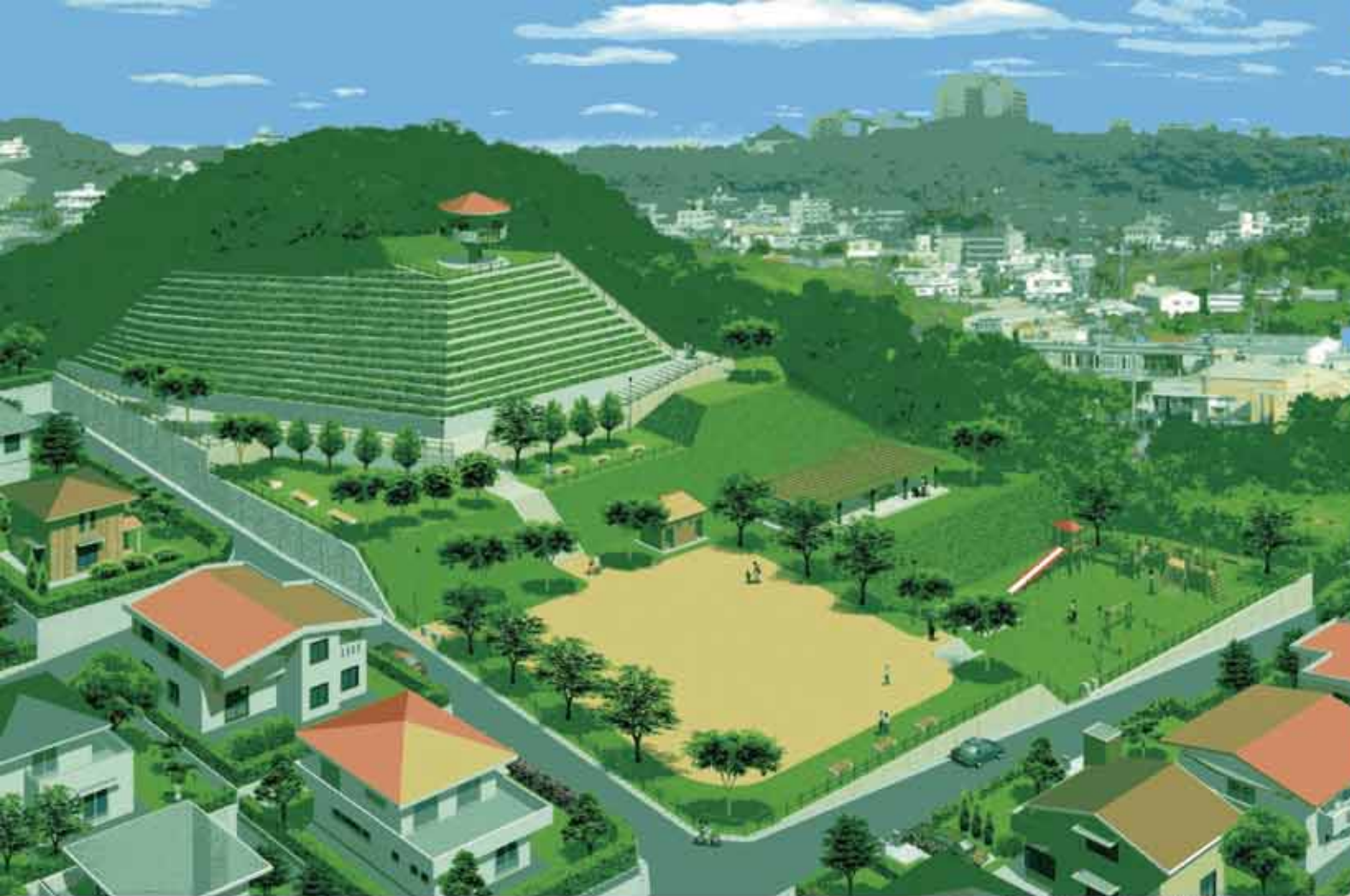
西原西地区土地区画整理事業完成イメージ