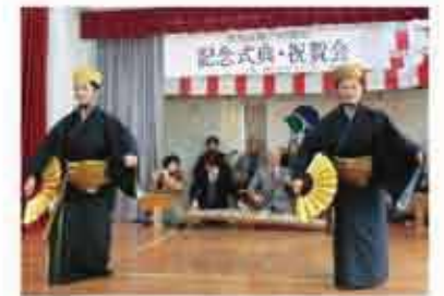
小波津団地自治会35周年記念式典