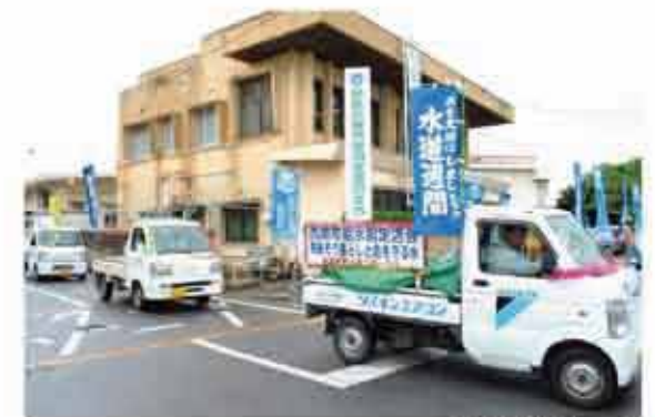
水道週間パレード