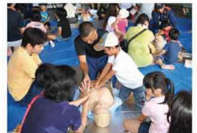
心臓マッサージを学ぶ