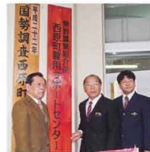
雇用サポートセンター

西原町はゴルフ観光や、マリンタウン地域の海浜レクリエーション空間が賑わいを見せています。さらに、国指定の文化財「内間御殿」をはじめとした、町内の地域資源の発掘と活用を推進するなど、観光基盤の整備に取り組んでいます。