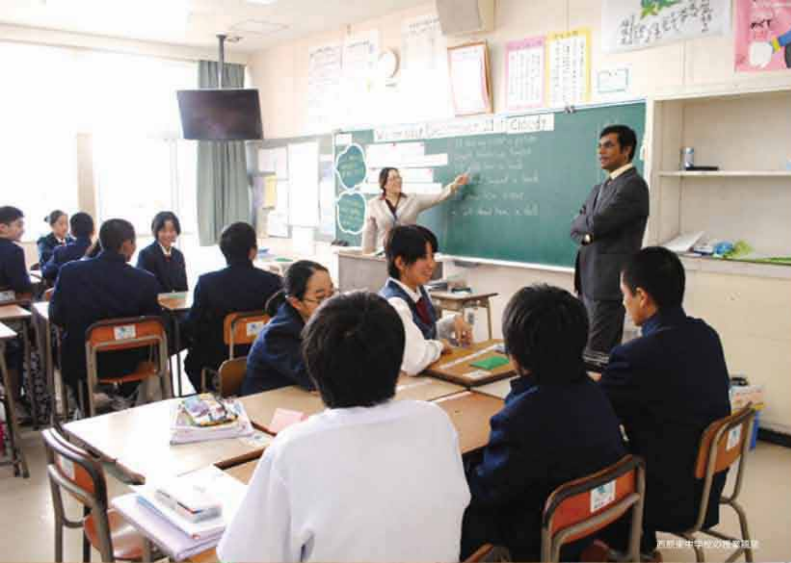
西原中学校の授業風景