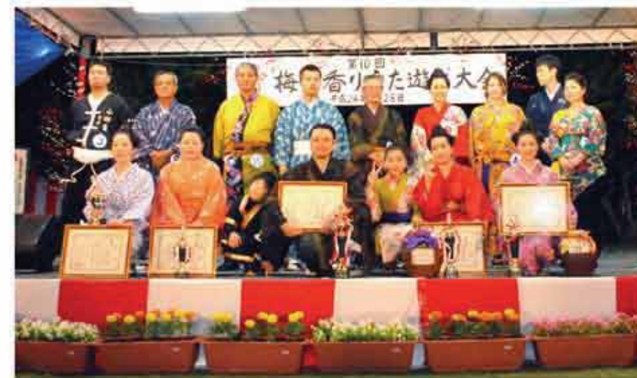
梅の香りうた遊び大会（小那覇区）