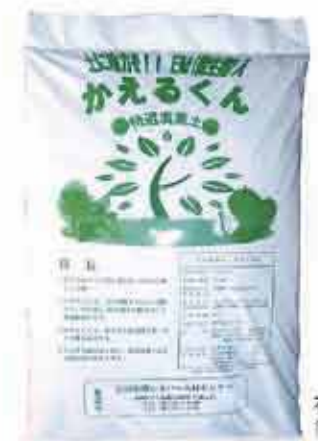
有機質堆肥 「かえるくん」