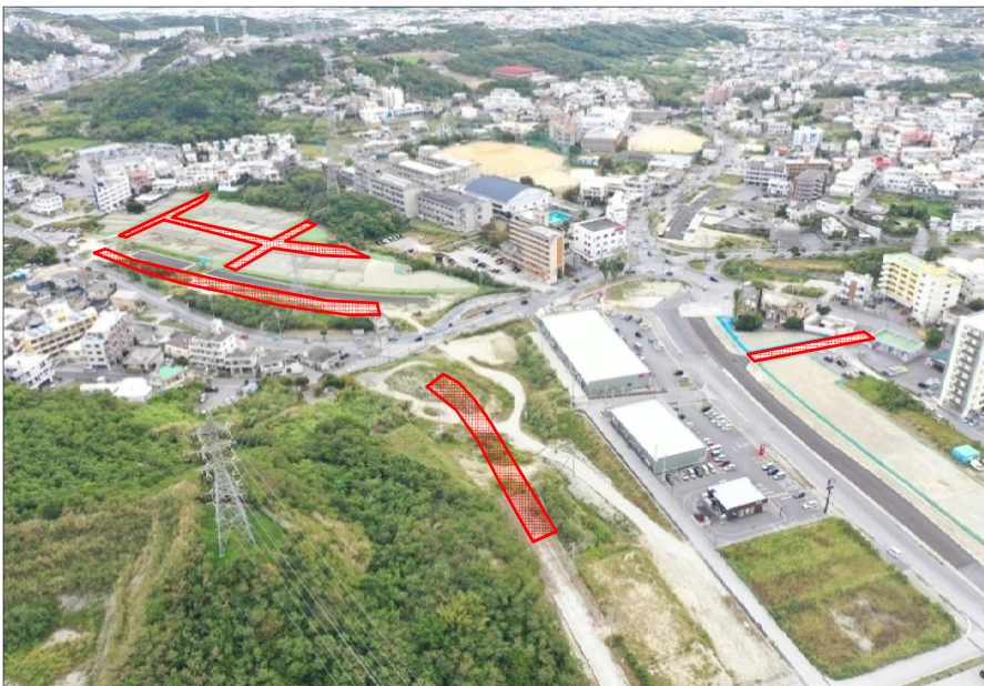
③徳佐田地区側から坂田交差点方向整備予定箇所(R6.1月撮影)