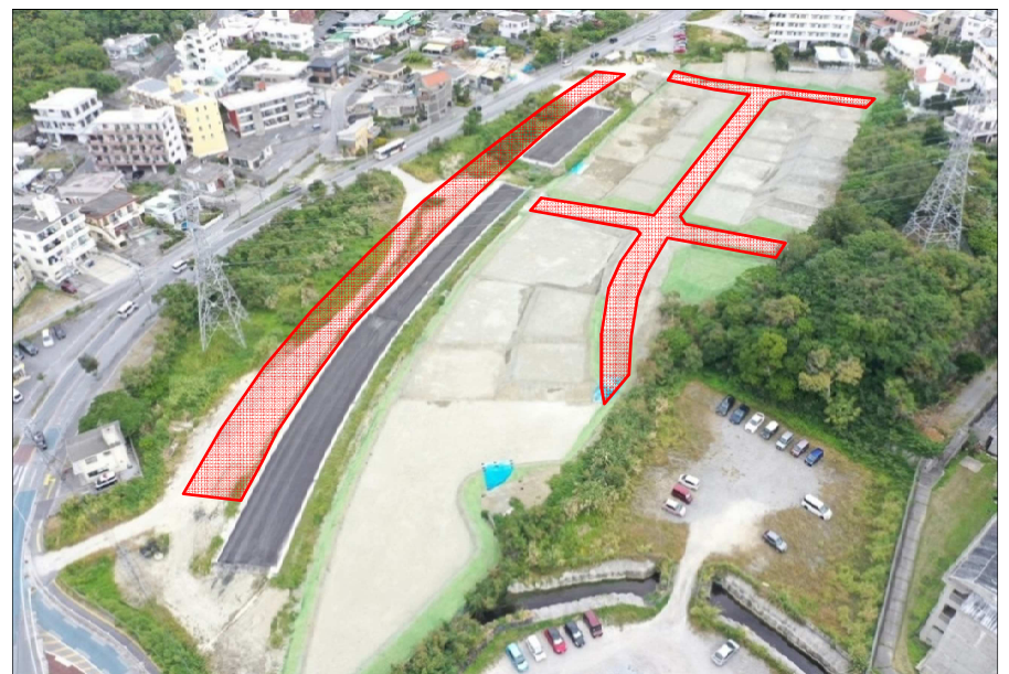
②坂田交差点側から上原方向整備予定箇所(R6.1月撮影)