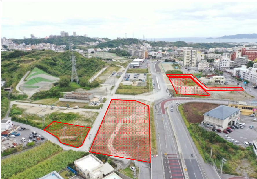
①浦添市側から東側方向整備予定箇所(R6.1月撮影)