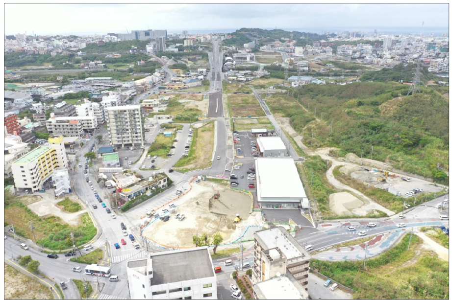
②坂田交差点側から西側方向整備状況(R5.3月撮影)