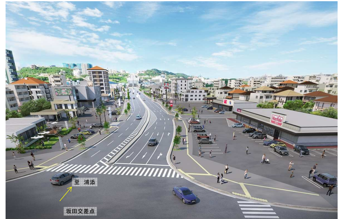
県道浦添西原線(浦添向け)完成イメージ図(R5.3月作成)