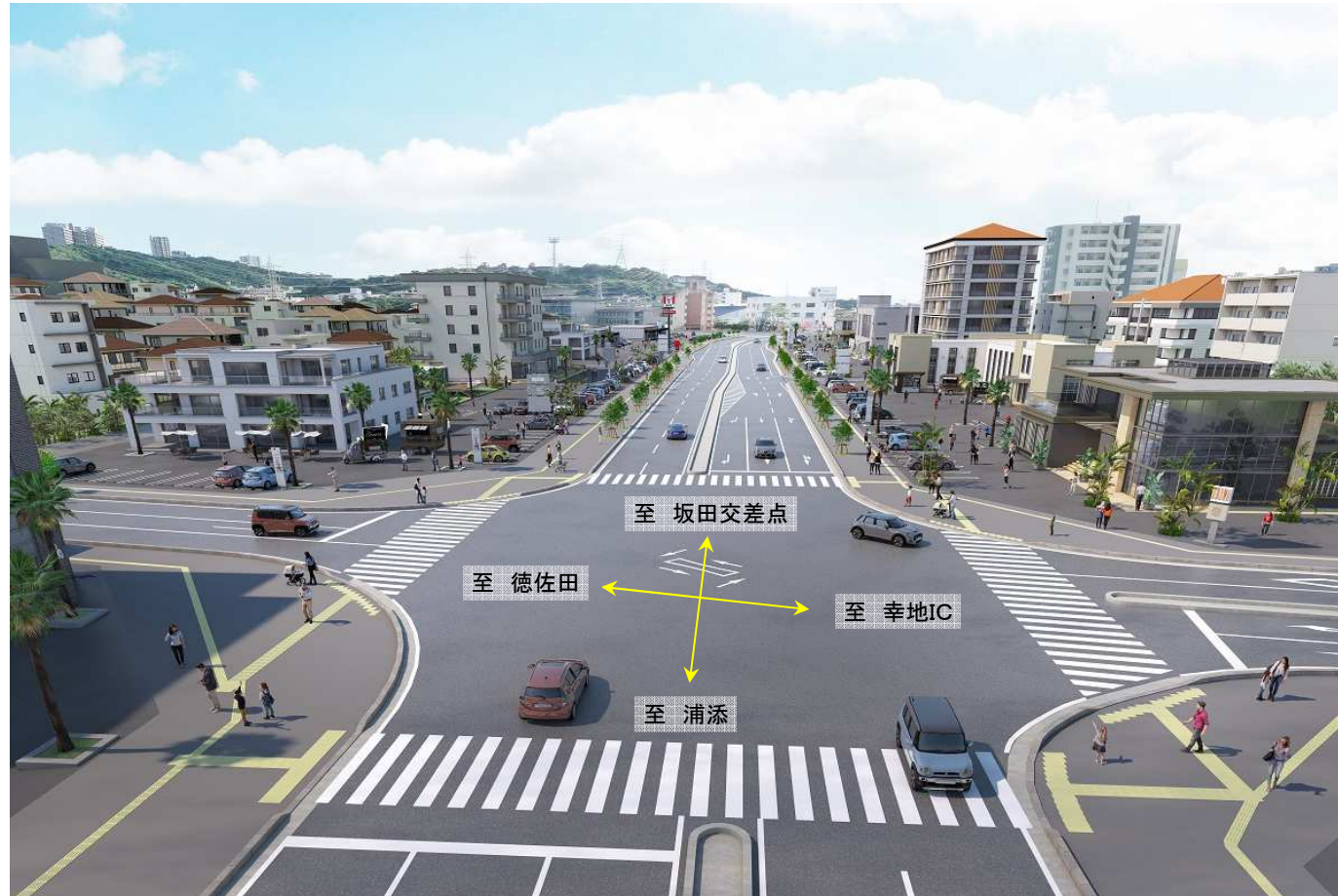
県道浦添西原線(西原向け)完成イメージ図(R5.3月作成)