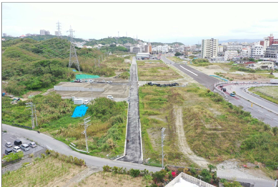
③区画道路一部工事完了(R5.3月撮影)(暫定供用開始)