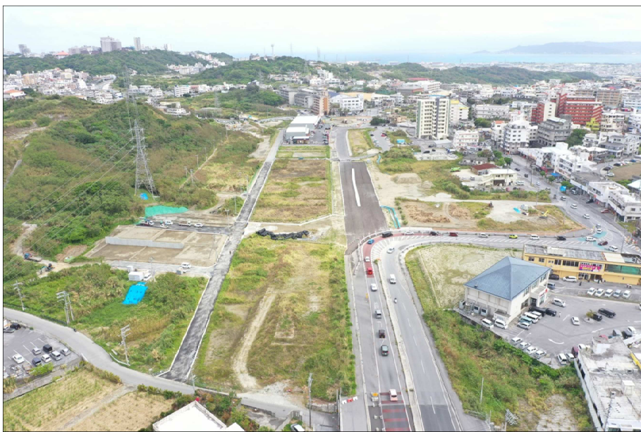
①浦添市側から東側方向整備状況(R5.3月撮影)