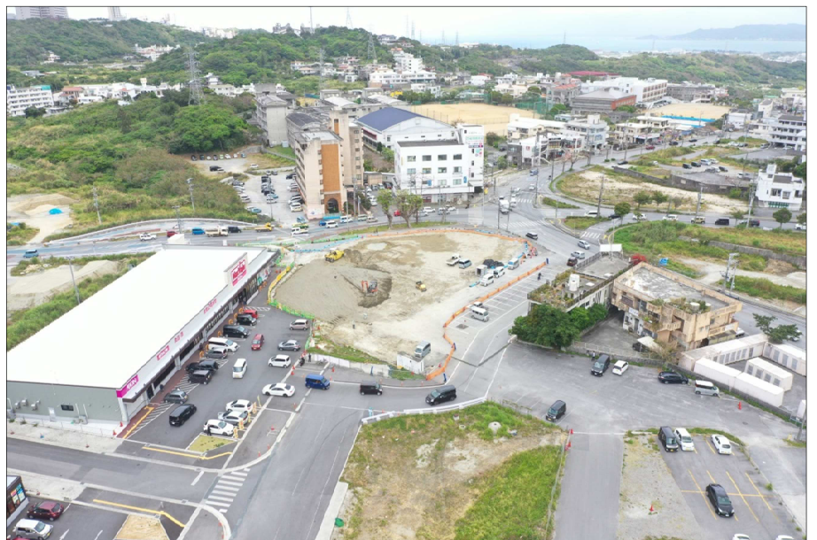
④坂田交差点周辺の施工状況(R5.3月撮影)