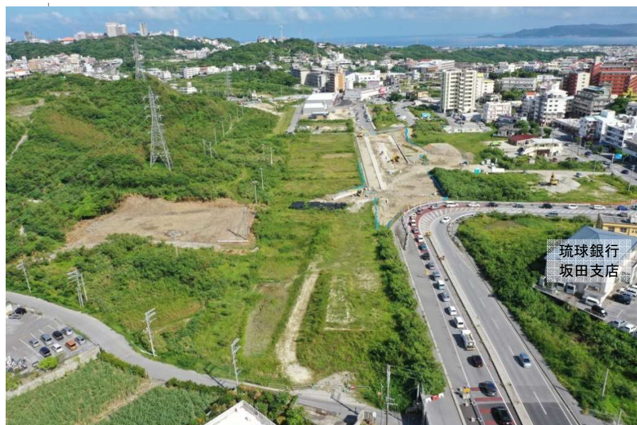
浦添市側から東側方向整備状況 (R4.9月撮影)