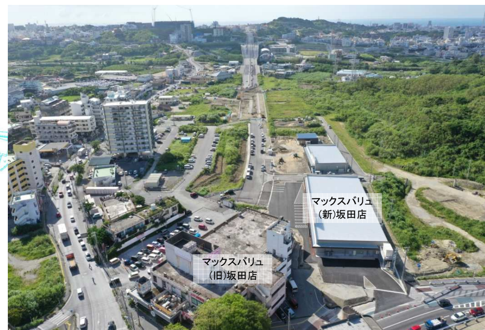
西原高校側から西側方向整備状況 (R4.9月撮影)