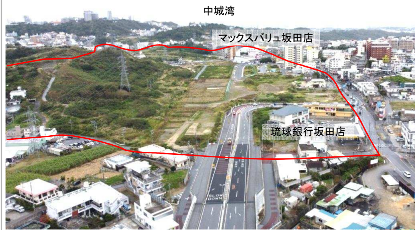
浦添市側から東側方向整備状況