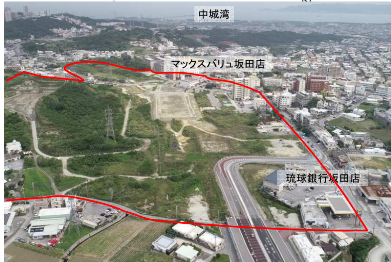
浦添市側から東側方向整備状況