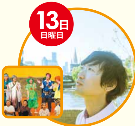
yamato kono band With 創作演劇「さわりんと運玉義留」