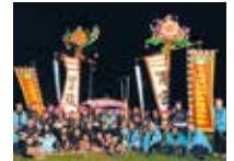
小波津伝統芸能保存会