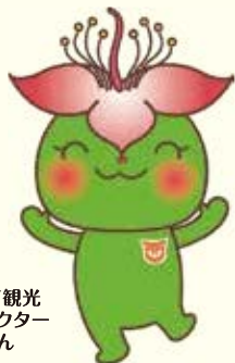
西原町観光 キャラクター さわりん