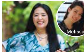
Lucyスペシャルライブ