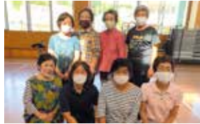
JAおきなわ西原支店 女性部