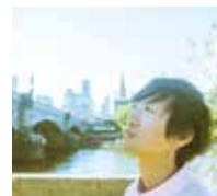
yamato kono band With 創作演劇「さわりんと運玉義留」