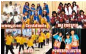
Dance studio AIR HEADS