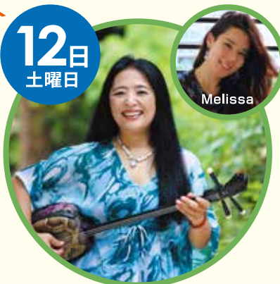
Lucy スペシャルライブ