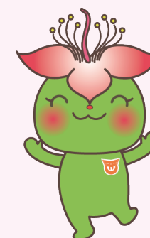
西原町観光キャラクター さわりん