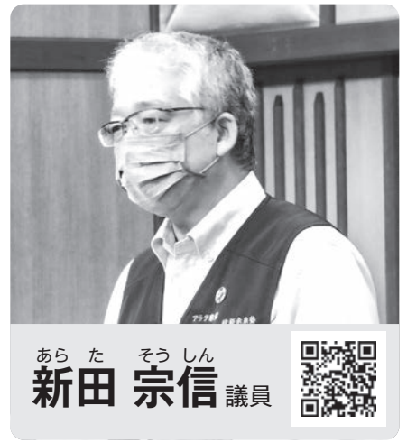
あらた そうしん 新田 宗信 議員

●この一般質問の内容は、会議録（反訳文）に基づいて各議員が質問の一部をまとめ、本委員会が最終確認・編集をしたものです。 ●各議員氏名横のQRコードからその議員の一般質問の動画をご覧いただけます。