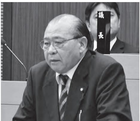
前里 光信 議員