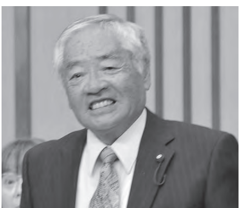
大城 好弘 議員

問 本町の人件費は沖縄県下でハイレベルの水準にある。職員給料の年額、職員定数、従事総人員数を問う。 総務部長 職員給料年平均額は530万円、職員定数は237人、従事総人員は職員233人、臨時嘱託職員は234人で合計467人となっている。