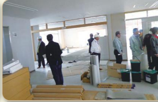
新增改築工事中の坂田小学校校舎を視察