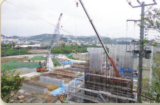
モノレール浦西駅建設予定地周辺を視察