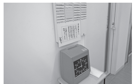
教職員の出退時間の把握にタイムカードの導入を

分析に入ります。提出物、研修会、会議等の負担の軽減をすべく、校務支援システムの導入を検討したい。