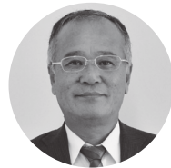
喜納 昌盛 議員