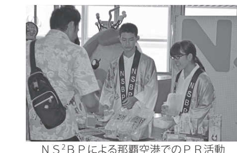
NS 2 B Pによる那覇空港でのPR活動

建設部長 現場を調査したところ、一部に土砂がたまって排水機能を阻害しており、11月以降の清掃を予定している。