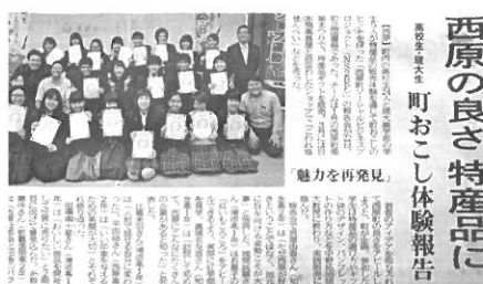
西原の良さ 特産品 町おこし体験報告

問 現在111億円の借財が町にはあり、平成34年まで増え続けるとの事だが、その対策と新たな自主財源は。