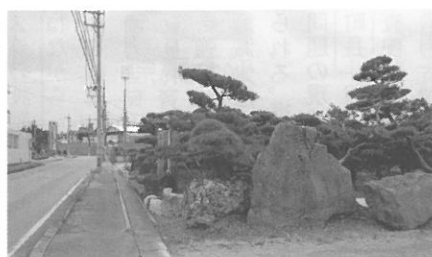
農地法違反とされる事例(小波津地域)

町民生活課長 5市町村の周辺には南斎場、いなんせ斎場のような斎場もなく、葬場だけの建設はどうか。