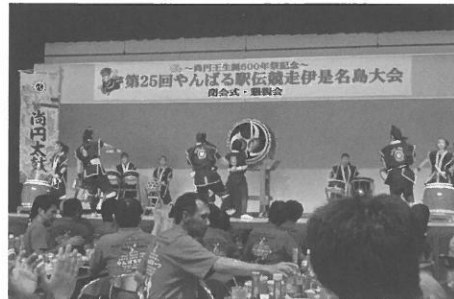
閉会式・懇親会を盛り上げた尚円太鼓