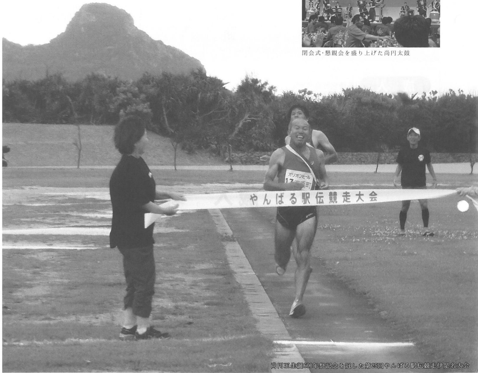
尚円聖誕600年祭記念を冠した第25回やんばる駅伝競走伊是名大会