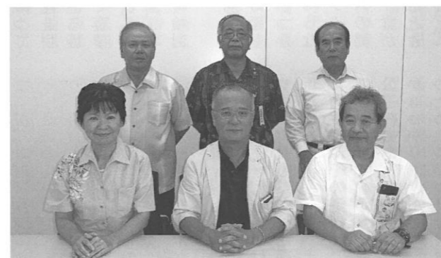
議会広報調査特別委員会

※政務活動費は、議会の審議能力の強化と議員の調査研究活動基盤の充実を図るための費用です。