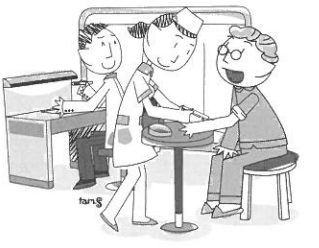
肺炎ワクチン(イメージイラスト)

問 役場は地域最大のサービス産業、町民目線、町民本意のサービスでお客である町民の満足度の向上につとめなければならぬ。そのため、「ISO9001」の認定を受けて「最大サービス」の実践を求めたい。 町長 民間で言えば品質向上の問題、顧客の満足度、ニーズ管理等であり、公共サービスにも基本的に求められると考えます。検討します。