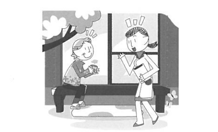
家庭訪問する民生委員(イメージイラスト)

問 町民交流センターの委託先は窓口、舞台関係それぞれ一社で2年契約。さわふじ未来ホールの自主事業として最初に行われるこけら公演を町文化協会と対等な関係、協働事業として協定書を締結して実施。