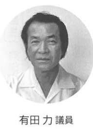
有田 力 議員

問 町民交流センターの委託先は窓口、舞台関係それぞれ一社で2年契約。さわふじ未来ホールの自主事業として最初に行われるこけら公演を町文化協会と対等な関係、協働事業として協定書を締結して実施。