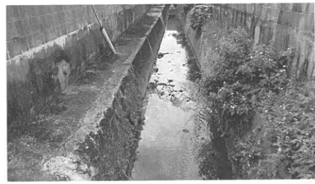
大雨による氾濫で危険な状況とされる水路

問 他府県においては、耕作放棄地を利用したソーラーシステム導入が盛んに行われている。国も農地転用を認める方向にあるが、西原町でも検討できないか。 建設部長 太陽光発電施設を農地に設置する場合は、農地の安全確保のため、市街化が進んでいる地域への誘導を行っています。転用申請があった場合には、許可基準に照らして許可することになります。基本的には、耕作放棄地や遊休地の活用については、農地として再生させることが第一であると考えています。