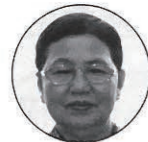
(2期目) 呉屋 カツエ(69) 小波津647-4

※選挙管理委員と補充員は、各議員が各投票区から1名づつ推薦し、2名以上の場合は投票にて決定されます。