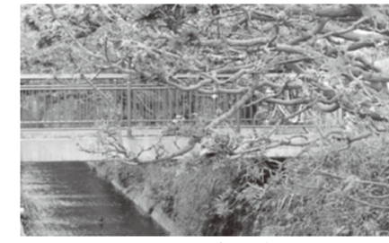
小津波川デイゴ並木