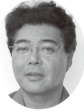
仲松 勤 議員