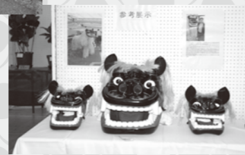
第5回西原町の産業まつり