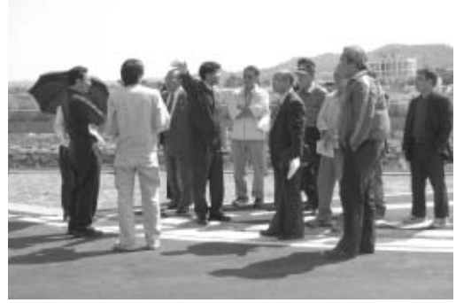
我謝マリンタウン線

町議会では、3月定例会会期中の3月12日に所管事務調査として、西原町民体育館、西原小学校校舎、我謝マリンタウン線、東崎都市緑地、小那覇マリンタウン線を視察しました。