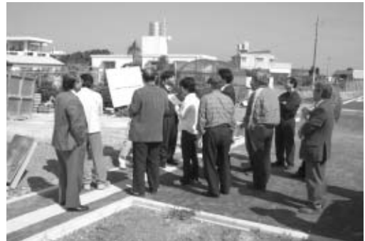
小那覇マリンタウン線