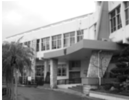
益々厳しくなる町財政

問 平成十八年度採用職員の一二次試験の順位と総合得点の情報開示が、審査会において私の申立てが全面的に認められた。この資料、総合順位と総合得点、しかも匿名。私の請求に対する拒否の理由、どこに採用基準や方針が推測されるのか説明を。 副町長 公表によって、今後採用試験の選考に支障がないよ