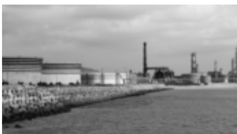
譲渡される南西石油株

教育長 小学校は西原町の平均は国語A・B算数A・B四項目すべて県の平均を上回っております。算数Aは全国平均と同点です。中学校も、中頭や県の平均を上回っておりますが全国の平均までは届きませんでした。今後、我々は自信を持ってこのまま施策を展開していきたいと思っております。ただ応用の方を格上げをして行くような指導を努力したい。