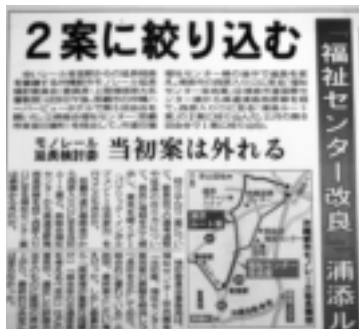
モノレール延長ルート案

企画政策課長 各行政事業の課題等を検証し、効率的で効果的な行政運営を図り、「民営化」に対する考え方についても事業計画調書のヒヤリングを継続し、行財政の改革に努めていきます。