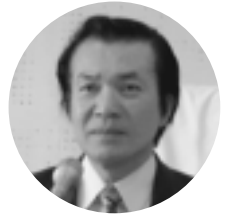
有田 力 議員