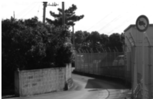
西原台団地入り口

いうことについてお答えいたします。平成十九年十月の事業計画調査ヒアリングの收支不足額が八億五七〇〇万円です。単年度平均の圧縮額は二億一四二五万円になります。又四年間における收支不足額の圧縮の見直しについてお答えいたします。圧縮額については四億円程度と見込んでおります。