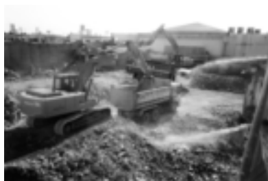
西原小学校校舎解体

当な意欲を持って、メタボの解消、町民の健康づくりに取り組もうとしているものですから、次年度の保健課、あるいは役場全体の取り組みを後押しをするような形で町としても頑張りたいと。議員がおっしゃっている体育館を思いきって町民の健康づくりにかえてほしいという提案でございますが、体育館は当然体育館の使命、役割、使用の方法、建てたときの補助金もあってその目的にあった使い方が今なされているだろうと思えます。