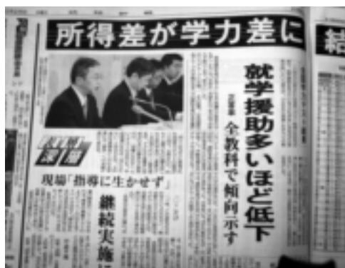
全国学力テストの新聞報道

おいていろいろライバルをつくりお互いに頑張ろうとの競争心は非常に人にやる気を出させる材料になります、他人を踏みつける、人をけ落とすことは絶対には己に勝つ意識でやれば、いい意味での頑張れる競争心だと思います。 問 執行体制の充実