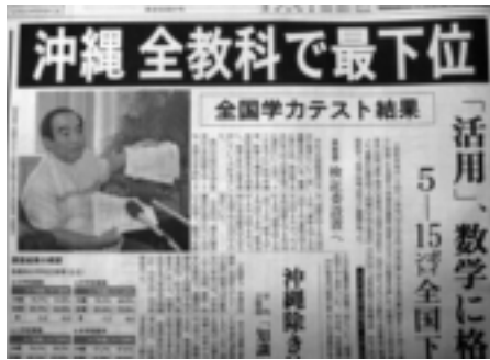
全国学力テストの新聞報道

都市計画課長 台風等の天災による営業損失は県は負担できないとの見解でした。補てん策として「きららビーチ紹介」のレンタカーへのカーナビ搭載、冬場のビーチ利用として修学旅行生の体験学習誘致等を検討し、損失の補てんに取り組みたいと考えております。