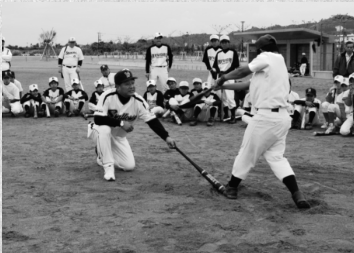
西原町少年野球教室

住所: 〒903-0220 沖縄県中頭郡西原町字嘉手苅112番地 TEL: 098-945-5005 発行: 西原町議会 編集: 議会広報調査特別委員会 印刷: 文進印刷(株)