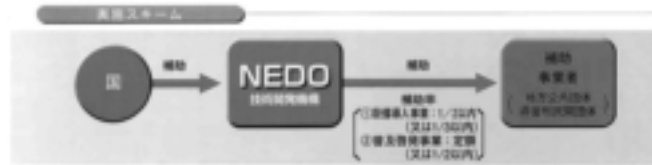
地域新エネルギー等導入実施図式

企画政策課長 地域新エネルギービジョンを導入するというところでせんだつての議会でお答えしておりますけれども、導入については平成二〇年度に申請する予定でございます。