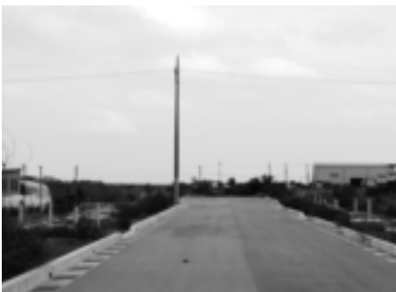
小那覇マリントウン線

指導主事 本町の学力向上対策はおおむね推進されております。今回の学力状況調査に左右されることなくこれまでどおり取り組みを日常的に子供たちの実態に合わせて取り組みたいと思っております。又、学校においても学習意欲の向上につなげていきたいと考えています。