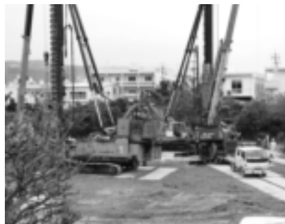
西原小学校改築工事

問 副町長は指名審査会の会長であるが、地元企業の優先発注、又育成を考 副町長 町内の企業については、指名率アップを図っている。今後も町内企業の受注拡大につながるよう精査検討したい。 問 副町長は指名審査会の会長であるが、地元企業の優先発注、又育成を考 副町長 町内の企業については、指名率アップを図っている。今後も町内企業の受注拡大につながるよう精査検討したい。